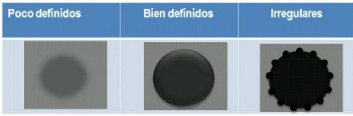
Figura 3. Esquema de hallazgos asociados a márgenes del nódulo en ecografía

Los márgenes del nódulo pueden ser descritos como bien definidos, irregulares o mal definidos. En los bien definidos, existe una clara distinción entre el nódulo y el parénquima que lo rodea, por su parte, en los mal definidos la demarcación entre el nódulo y el parénquima glandular normal que lo rodea es pobre. Los márgenes irregulares pueden ser a su vez microlobulados o espiculados; Los márgenes microlobulados y espiculados son sugestivos de malignidad, mientras que márgenes poco definidos y mal definidos pueden ser observados en lesiones nodulares benignas y malignas 10 .