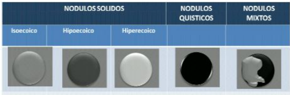
Figura 4. Esquema de hallazgos ecográficos relacionados con ecogenicidad en ecografía tiroidea

Los nódulos malignos, tanto carcinomas como linfomas, típicamente se presentan como lesiones sólidas e hipoecoicas cuando se comparan con el parénquima tiroideo que los rodea. La especificidad y valor predictivo positivo de éste signo es del 92 y 68%, respectivamente 10 .