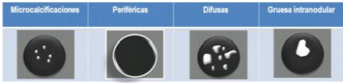
Figura 1. Esquema de hallazgos asociados a calcificaciones en ecografía tiroidea