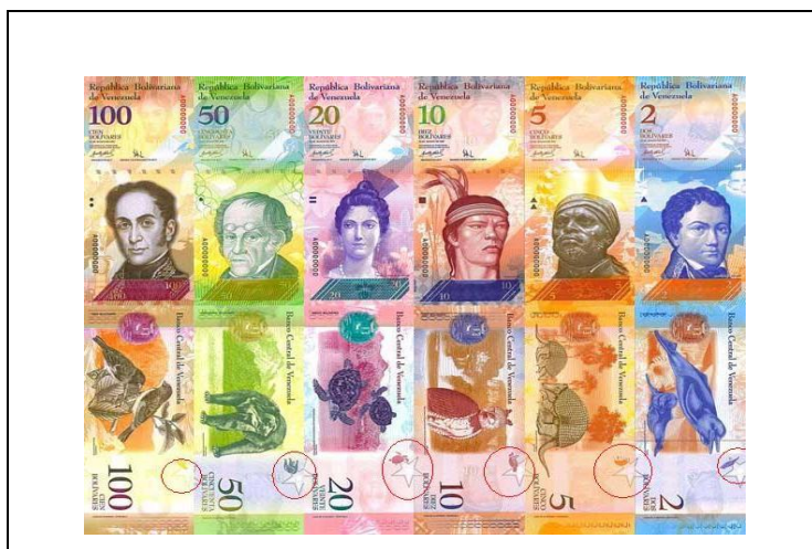
Fuente: Billetes de Bolívar Fuerte, estrellas resaltadas por el autor de la presente monografía.