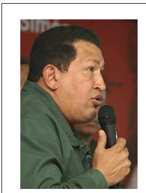
Grafico 1. Presidente Chávez reconoce derrota del referendo de 2007 en atuendo militar.

Fuente. Motor de búsqueda online. Criterio. Referendo Venezuela 2007