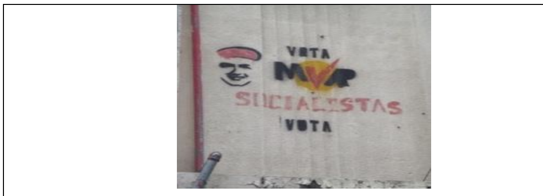
Gráfica 2. Boina Roja en propaganda del MVR