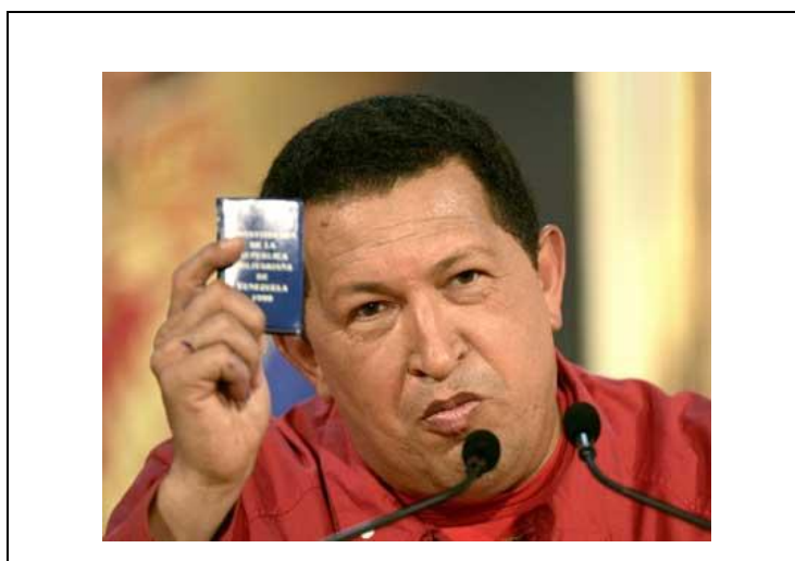
Gráfico 9. El presidente Chávez y la Constitución de 1999