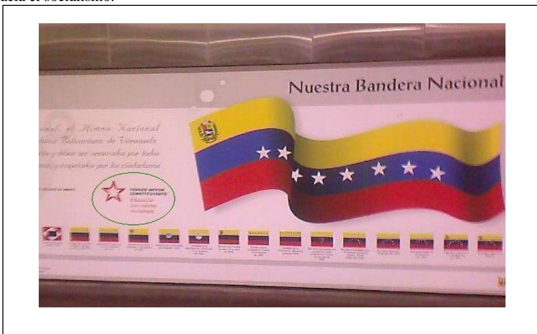
Gráfico 8. Estación del metro de Caracas. Nueva Bandera y Campaña de cinco puntos hacia el socialismo.