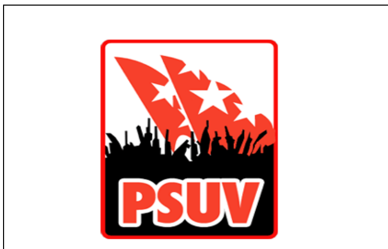
Gráfico 3. Uso de símbolos típicos del socialismo