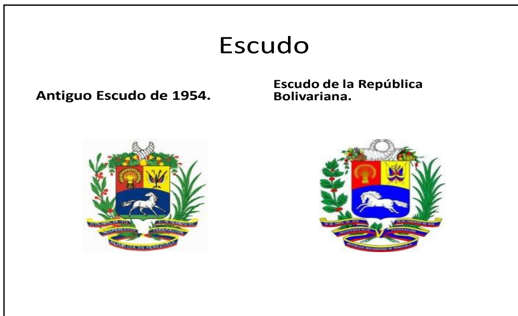
Gráfico 4. Comparación de Escudo de Venezuela de 1954 y Escudo de la República Bolivariana de Venezuela. Elaborado por el autor de la presente Monografía con información de la página Wb del Ministerio popular para la defensa de la República Bolivariana de Venezuela