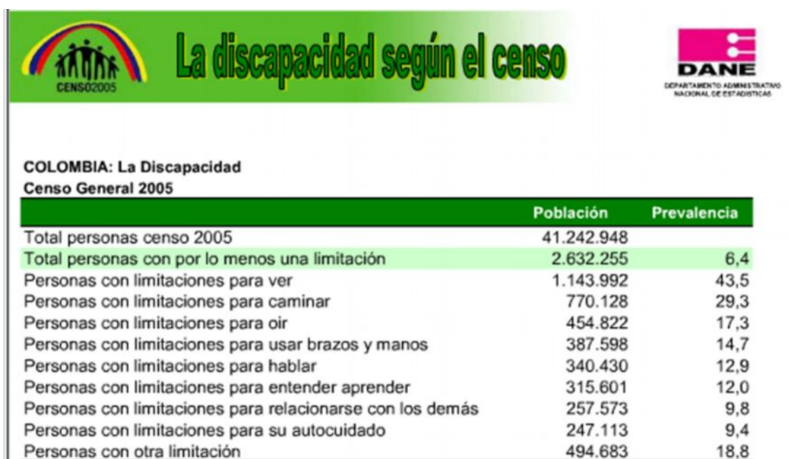
Tabla 2: La Discapacidad Según el Censo en Colombia

Las cifras que se presentan a continuación se consultaron de estudios realizados por el Departamento Administrativo Nacional de Estadísticas, del Censo de año 2005 y estudios realizados por el Ministerio de la Protección Social.