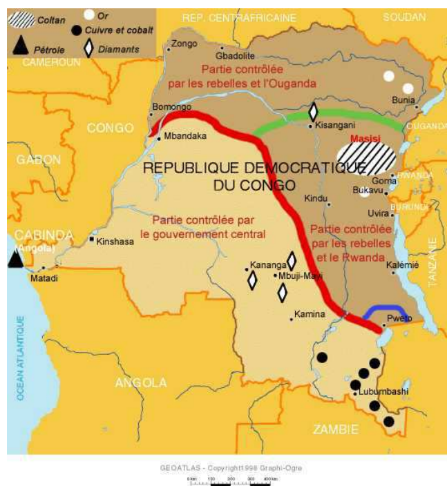
Gráfica 1. Mapa de República Democrática del Congo y distribución de recursos naturales. 24

En enero de 1999 el país se encontraba dividido en dos grandes zonas: una parte del norte y del este controlado por los rebeldes y el resto por el gobierno. 23 Los grupos ilegales, tanto de RDC como de Uganda y Ruanda se apoderaron de las zonas más ricas del país en cuanto a recursos minerales; igualmente el gobierno congoleño tenía tropas de soldados regulares en las zonas de conflicto, pero su participación no era de carácter regulador, al contrario, su presencia infundía el miedo entre la población, ya que también eran responsables de violaciones en contra de Derechos Humanos.