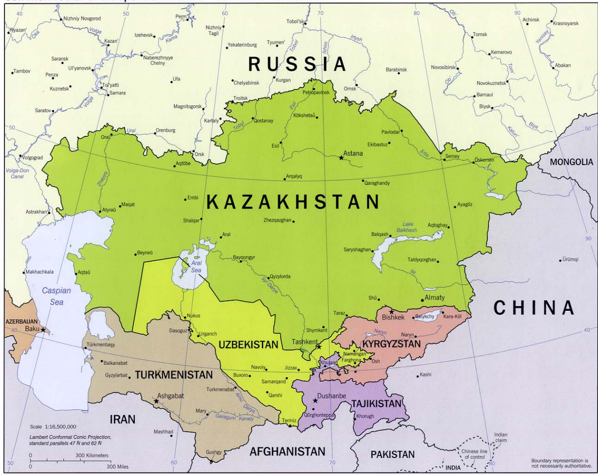
Commonwealth of Independent States - Central Asian States