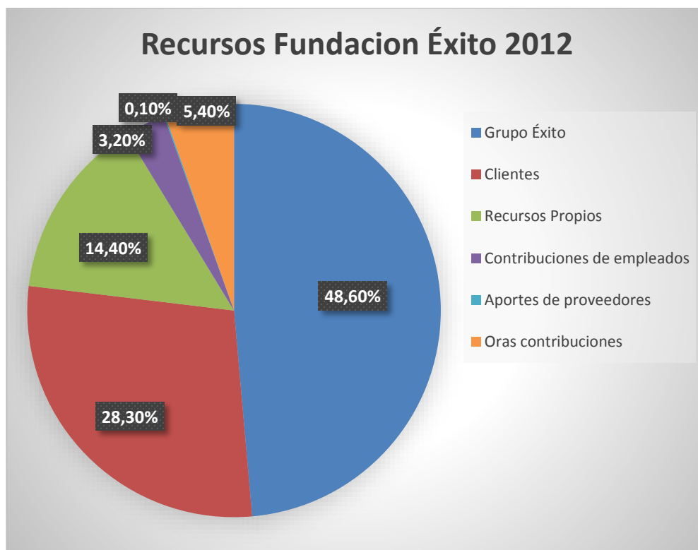
Ilustración 2 ¿De dónde viene el dinero invertido en los niños?, "Informe de Sostenibilidad Grupo Éxito", 2012

Uno de los pilares más importantes del Grupo Éxito se encuentra en el respeto por los derechos y la diversidad, que por medio del Informe de Sostenibilidad 2012 del Grupo Éxito se muestra como se garantiza y promueve el respeto por los derechos humanos y laborales, entre estos el derecho a la vida, a la no discriminación, a la libre asociación sindical y a la negociación, entre otros.