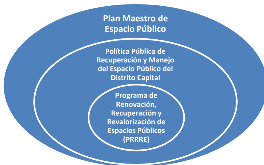
Gráfica 1. De lo general a lo particular.