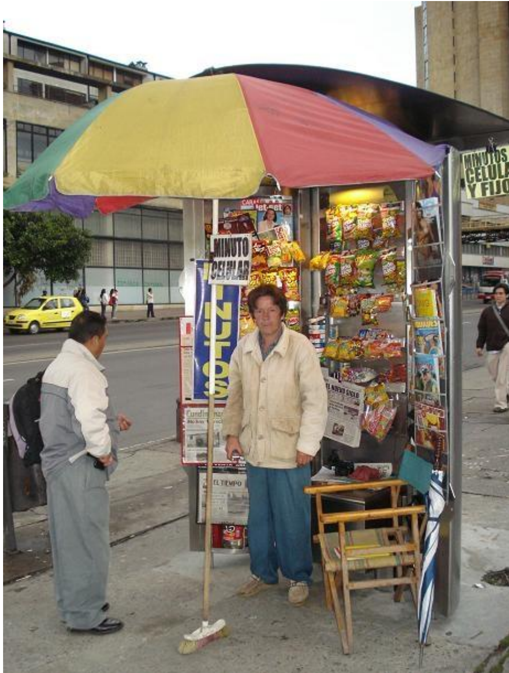
Fuente: Barrios de Bogotá. Quioscos de Bogotá.