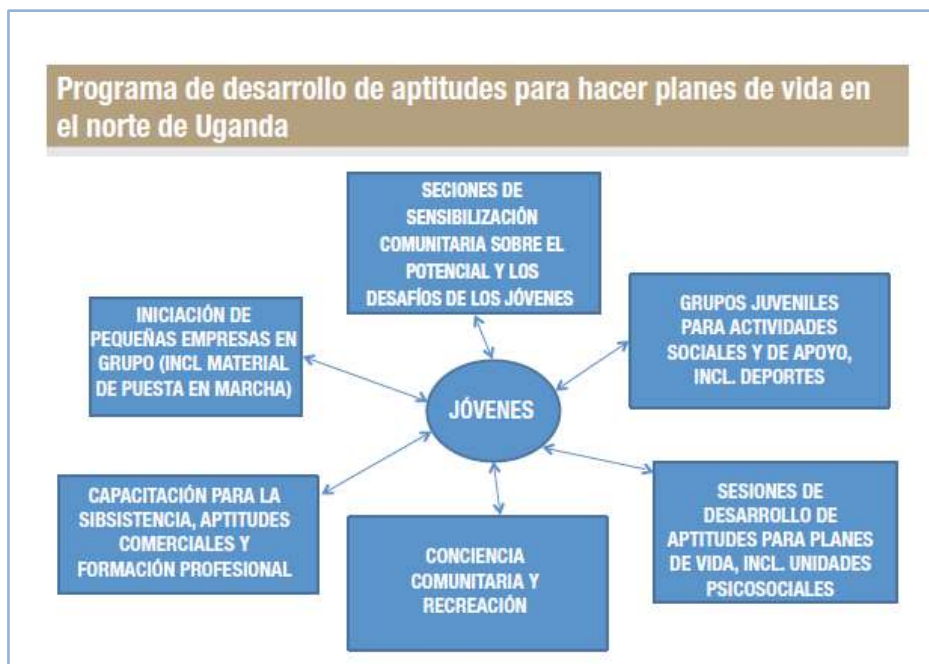
Grafica 3. Programa de desarrollo de aptitudes implementado por CICR