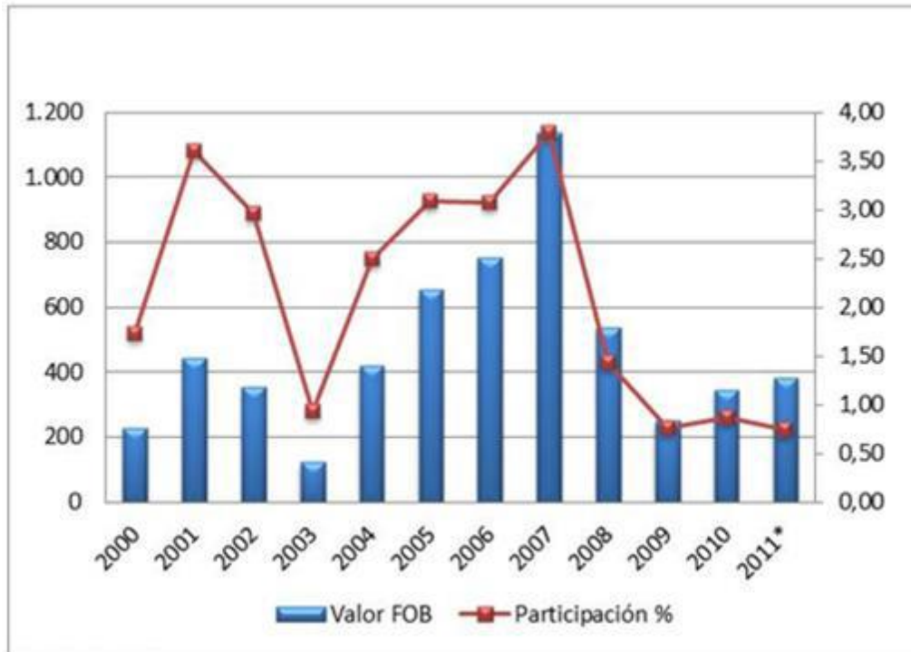
Gráfica 2: Exportación fabricación de vehículos 2000 – 2011 (Millones de dólares FOB)