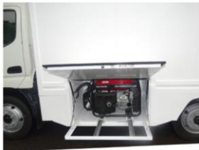
Lateral Izquierdo (planta eléctrica)