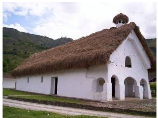
Capilla San Andrés de Pisimbalá, antes y después de la restauración de cubierta.

Capillas en proceso de deterioro, localizadas en los cabildos en los que se llevara a cabo el proyecto piloto.