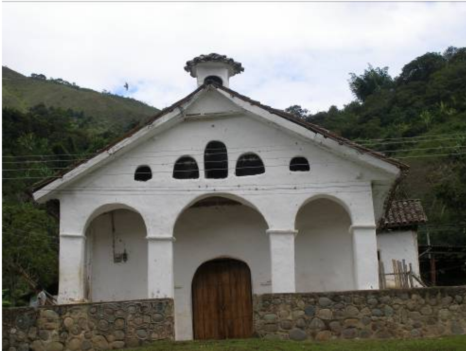
Capilla Doctrinera de Avirama. Foto 7: Carolina Márquez Díaz