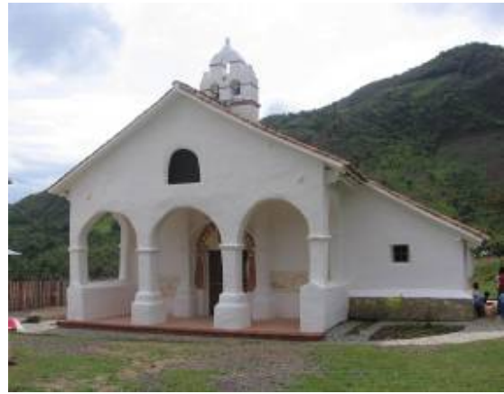
Capilla Santa Rosa de Lima, antes y después de la restauración.