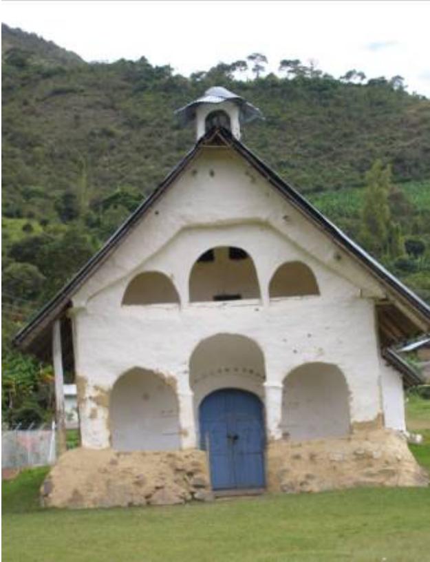
Capilla Doctrinera de Chinas