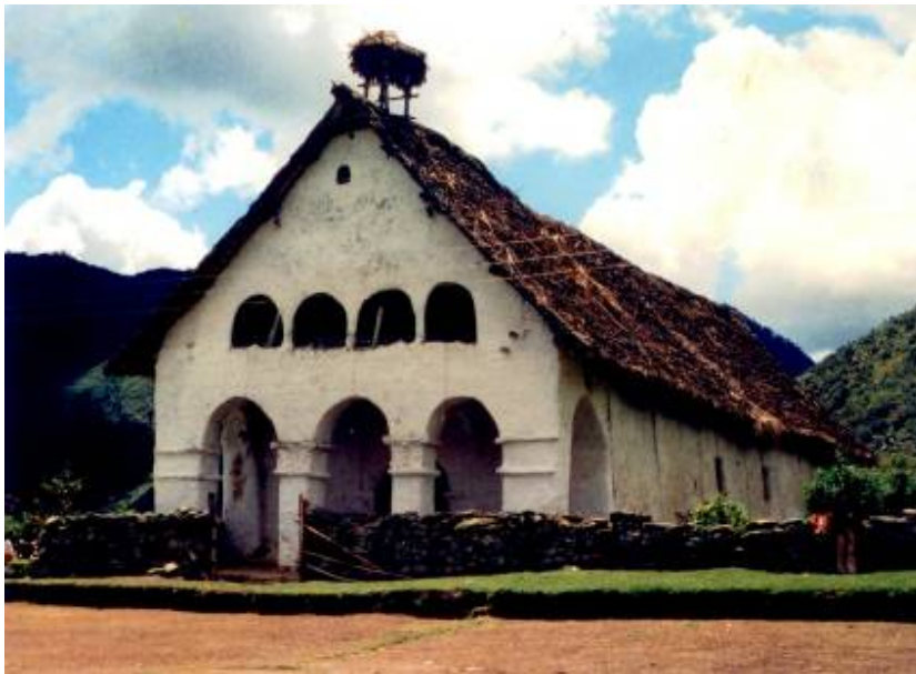
Capilla Nuestra Señora de la Inmaculada Concepción de Calderas.

Esta Capilla fue levantada en 1682, con esta edificación se incorporó la categoría de pueblo y formo “parroquia” por espacio de doscientos años. Esta era la capilla Páez de mayores dimensiones y constituía el principal centro religioso.