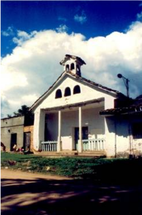
Capilla Santa Bárbara de Toes

Toes se considera la región más pequeña de Tierradentro, fue encomienda en 1714