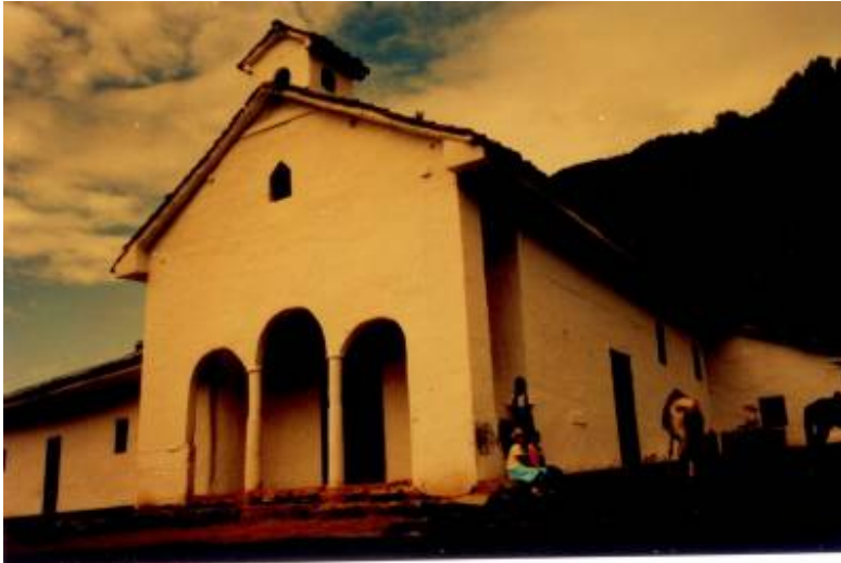
Capilla de San Vicente de Ferrer de Hwilla, construida entre 1695 y 1699.