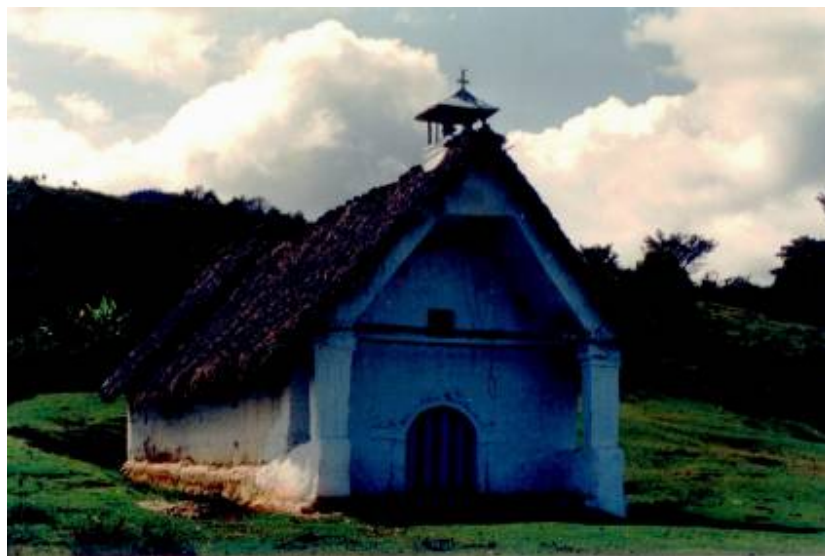
Capilla Santa Bárbara de Lame

Las obras culminaron en 1644, propuesta por los misioneros católicos y respaldada por el Cacique Echech 7 . Sufrió serias afectaciones en el terremoto de 1994, debido al peligro que representaba fue demolida por el INVIAS.