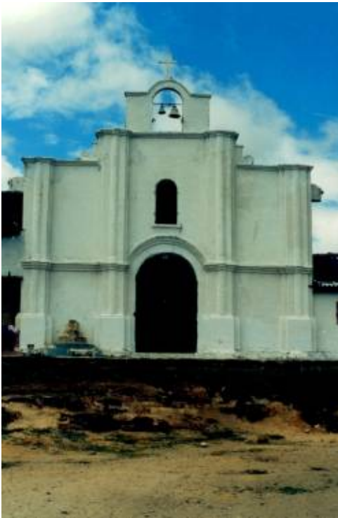
Capilla San Fernando de la Inmaculada Concepción de Vitoncó.

Esta población era la capital general del territorio Páez y a la cual llamaban en su lengua Chamboguala, que quiere decir "Pueblo Grande" Los Franciscanos le pusieron el nombre de San Fernando de Vitoncó.