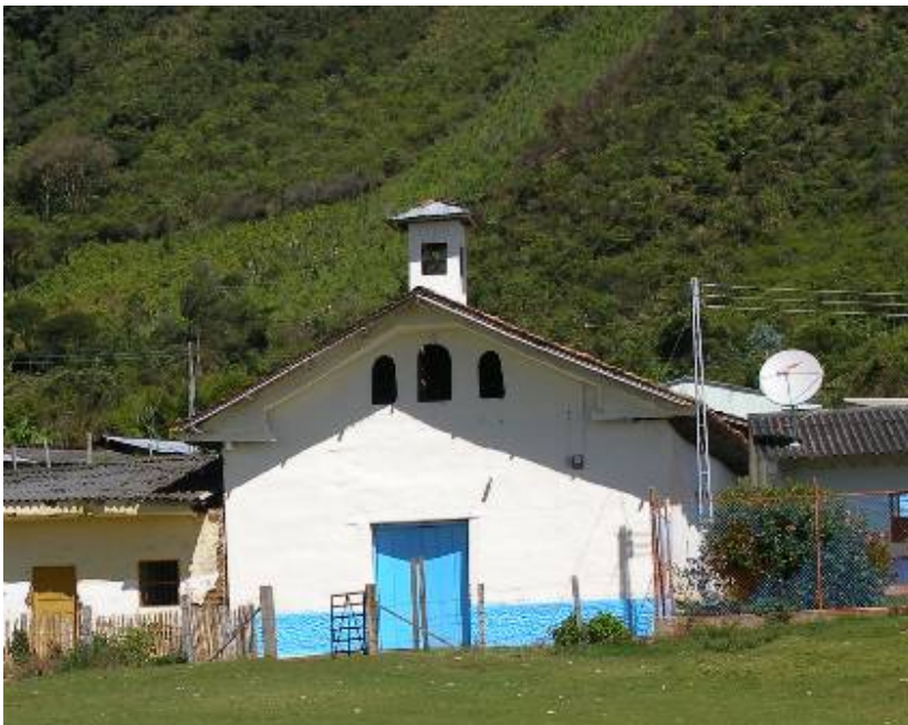
Capilla Doctrinera de Togoima