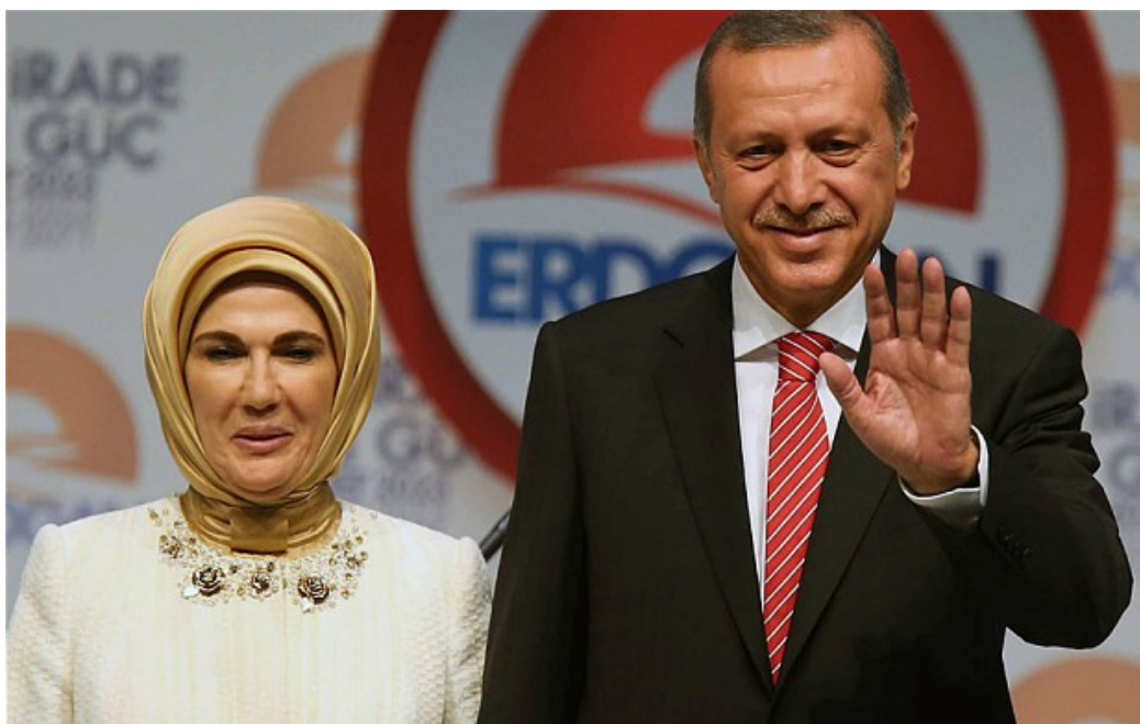
Imagen 1. Recep Tayyip Erdogan con su esposa Emine Erdogan

El tema del hiyab sobresalió aún más en el año 2005, cuando se presentaron casos por parte de estudiantes que fueron víctimas de discriminación y rechazo en las instituciones educativas, que no les permitían presentar sus exámenes si estaban usando dicha prenda. (Pope, N, 2006. Pág. 131) Estas situaciones en las que las mujeres hacían públicos sus casos sin temor al rechazo fue una consecuencia de que el AKP estuviera en el poder, ya que revivió el deseo de lucha en hombres y mujeres y recupero el vínculo de identidad entre el pueblo y el gobierno.