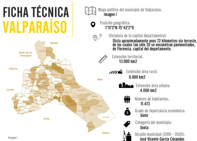
Mapa 1. Municipio de Valparaíso