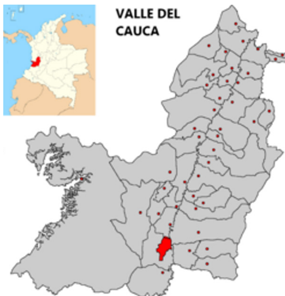
Mapa 1. Jamundí en el mapa político del Departamento del Valle del Cauca