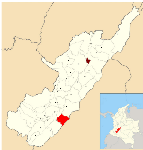
Mapa 1. Municipio de Guadalupe