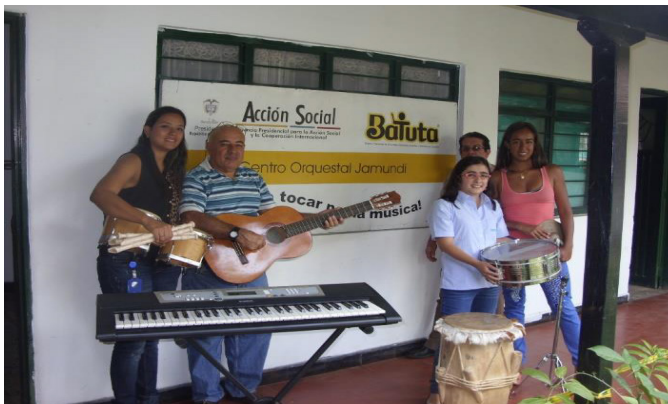
Imagen 1. Participantes del programa el Municipio de Jamundí