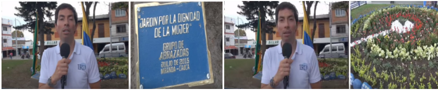
Gráfica No. 1. Jardín por la Dignidad de la Mujer.