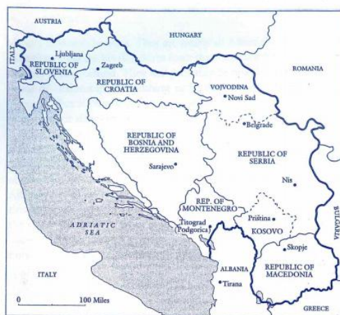
1. Yugoslavia, 1945-1989