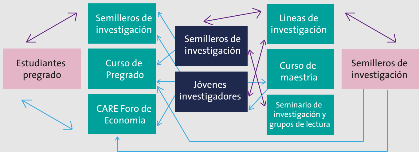
Figura 1. Jóvenes investigadores protagonistas en docencia e investigación

Los estudiantes de la Maestría y los Jóvenes Investigadores juegan un papel fundamental en garantizar la complementariedad entre la actividad investigativa de la Facultad y la docencia en sus diferentes niveles: pregrado, maestría y doctorado. Como se aprecia en la figura 1, ellos participan activamente en las actividades de los investigadores y estudiantes de doctorado (seminarios, investigaciones, grupos de lectura, etc.).