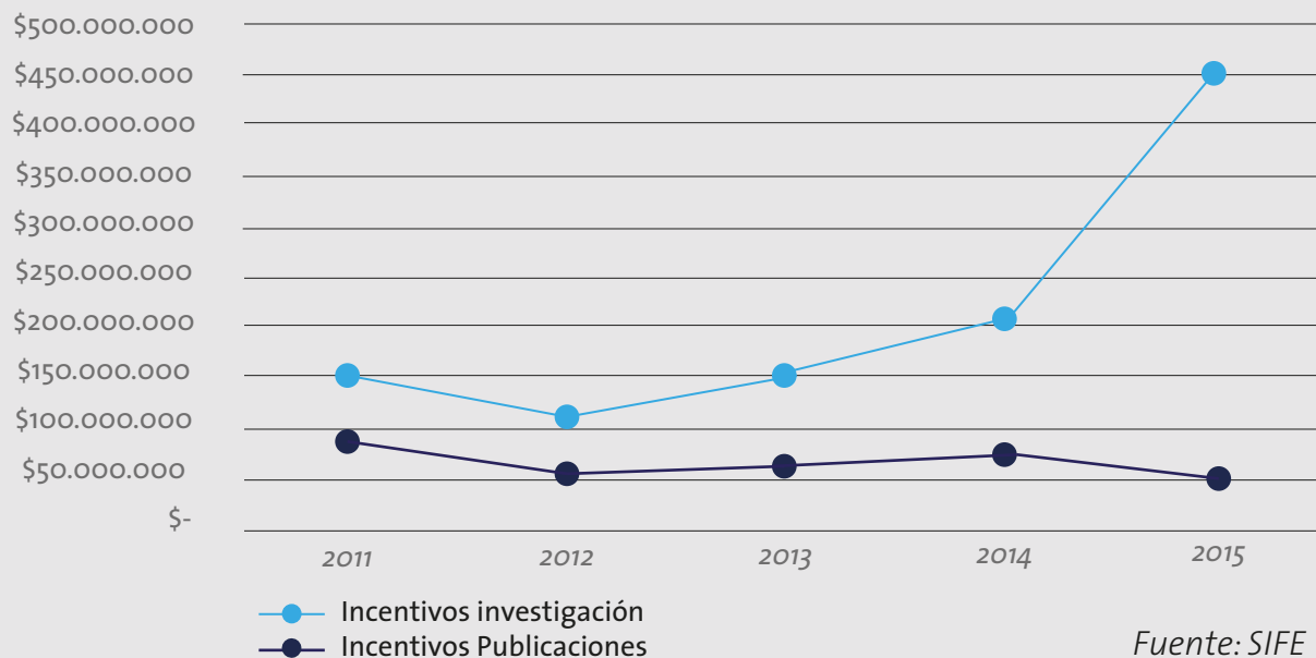
Gráfico 1. Incentivos económicos por publicaciones, proyectos de investigación, asesorías y consultorías otorgados a los profesores de la Facultad de Economía, 2011-2015.

El Grupo de Investigación de la Facultad de Economía comenzó formalmente en el año 1999 con doce profesores de planta. Actualmente cuenta con 25 investigadores de carrera, 2 investigadores temporales, 16 estudiantes de doctorado y 25 jóvenes investigadores. En el gráfico 2 se observan las diferentes líneas de investigación en las que trabajan los profesores de carrera de la Facultad.