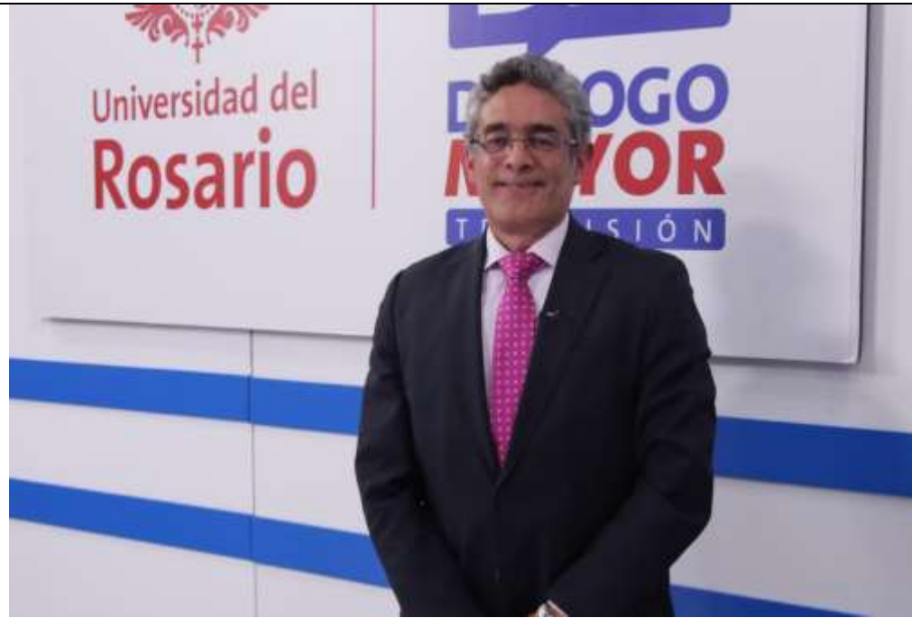
Foto del invitado