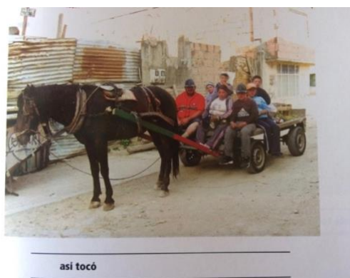
Fotografía No.2. “Así Tocó” Autora: Flor – Transformación del dolor Muestra “Memoria Soy Yo- Ensayos Fotográficos”, 2011.

En esta publicación se refleja la preocupación de la Casa de la Mujer por contar la historia del conflicto armado y el desplazamiento desde la mirada de las mujeres, es el resultado del trabajo en seis regiones del país, incluyendo a Bogotá D.C. en el marco del proyecto, fueron capacitadas y sensibilizadas para la construcción de la memoria histórica y se le dio un sentido político a la fotografía para que evidenciaran sus resistencias y sueños. Esta publicación de más de 250 páginas muestra cómo han superado las violencias y los problemas comunes en sus regiones, sin caer en la