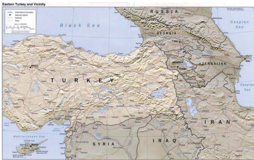
Gráfico 2. Mapa de Turquía y su vecindario.