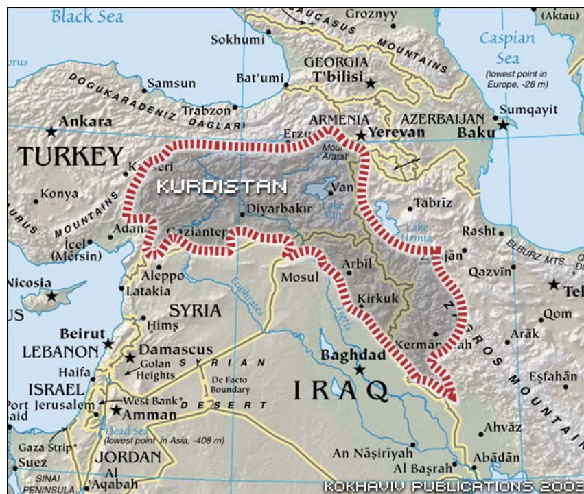
Gráfico 1: Mapa del Kurdistán.