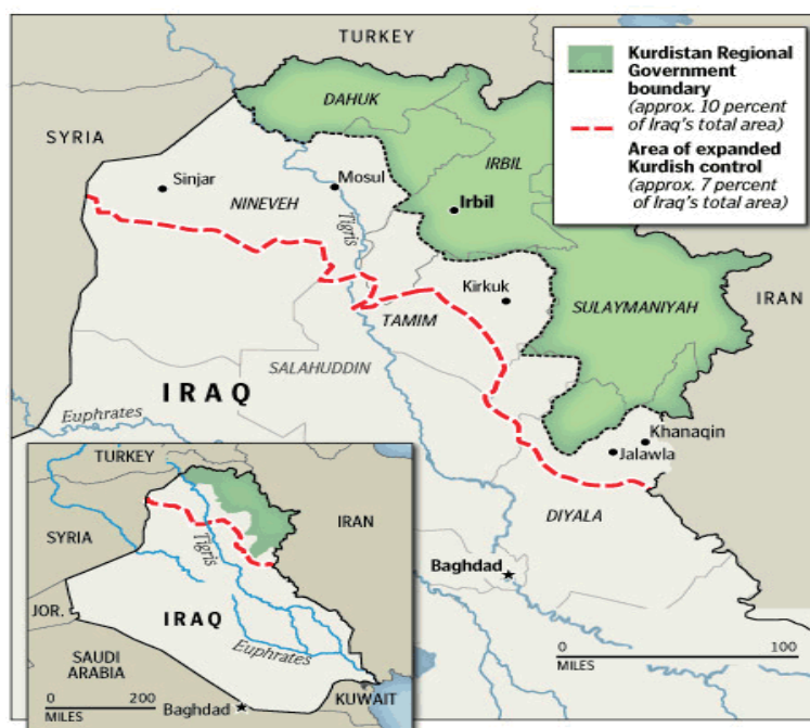
Gráfico 4. Mapa del Gobierno Regional del Kurdistán.