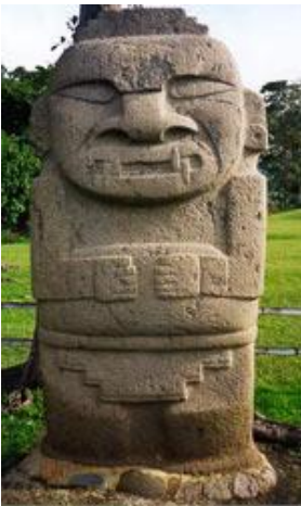
Figura 3. Dios Felino Cultura San Agustín