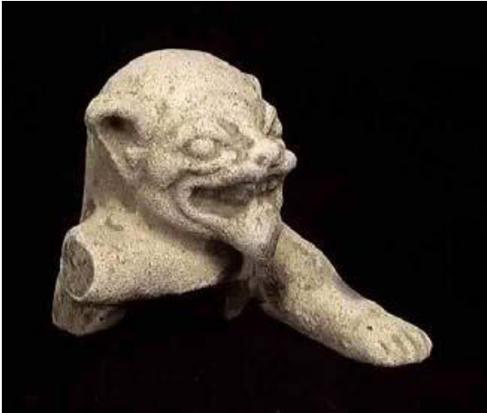
Figura 1. Jaguar en Cerámica Cultura La Tolita (Tumaco) 300 AC – 300 DC