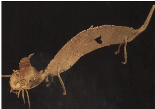
Figura votiva en forma de felino-serpiente. Muisca 600-1600 d.C. Soacha Cundinamarca. Fundición a la cera perdida