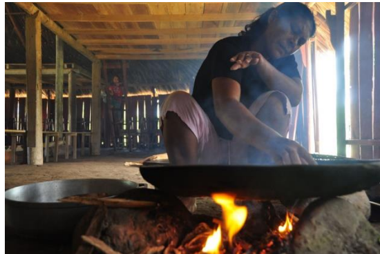
Fotografía mi madre haciendo casabe

comida, el proceso de siembra, de pesca y demás. Por otro lado, se apropiaron de instrumentos tecnológicos como la grabadora y una cámara digital.