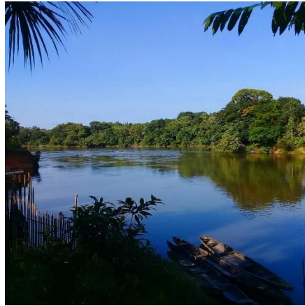
Fotografía vista del Rio Igará-paraná desde la casa de mis abuelos.