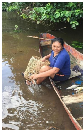
Fotografía pesca y reconocimiento de peces