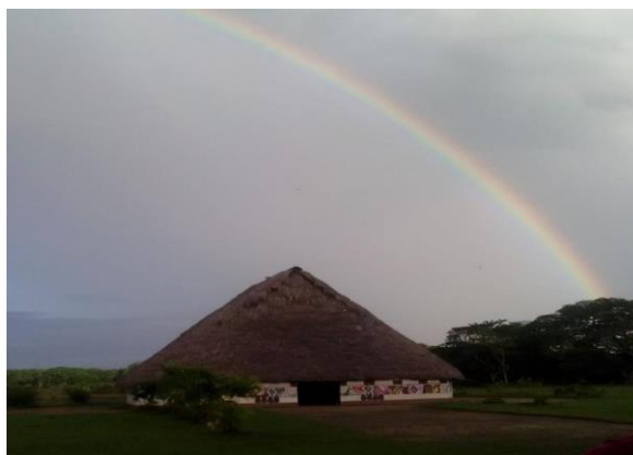
Fotografía de la Maloka del Resguardo Maguare

Maloka (ananeko). En la construcción de la maloca, casa colectiva indígena, toda la arquitectura tiene significado. La maloca simboliza a la madre, por esa razón tiene ancha su arquitectura. Los cuatro estantillos significan el hombre que sostiene a la mujer en estado de gestación, los cuatro travesaños significan que los hombres habitantes de la maloca dominan espacio, agua, tierra y la autoridad. Los mataqueros son los tíos y primos que sostienen a esa comunidad. En la parte derecha queda el sitio sagrado para el mambeadero y el yerafo, totumo con ambil. Es la oficina máxima de los indígenas, donde se programan todas las actividades y se deliberan sobre todos los conceptos de lo que esa comunidad necesita para vivir en armonía. En la parte izquierda está el medio de comunicación, el manguare, que informa a través de su toque sobre los acontecimientos de esa maloca. Como representa a la madre, en la maloca se debe ofrecer la caguana a sus habitantes y a las personas que llegan. Los hombres indígenas somos descendientes de Moo Buinaima y es por eso que, cuando muramos, nuestro cuerpo se transformará en agua y en la maloca, como madre, se debe ofrecer agua para sus hijos. En la cultura indígena uitoto, mezquinar el agua tiene muchas consecuencias en las mujeres; por ejemplo, si una mujer mezquina el agua, se dice que cuando le llega el momento de parto el agua faltará y la mujer sufrirá un poco más de lo normal. (Kuetgaje, 2019).