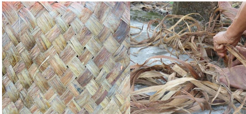
Fotografía abuela tejiendo escurridor