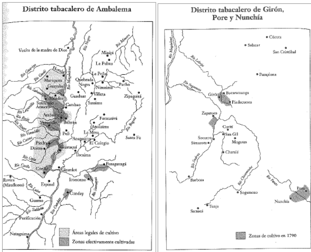
Imagen 2 : Zonas legales en el distrito de Ambalema donde se podía cultivar en 1780 y zonas de cultivo de Girón en 1790, tomada de Harrison, J (1977)

La medida de restringir las zonas para cultivar el tabaco, generó un efecto negativo entre los campesinos, quienes buscaron otros métodos de subsistir en otros sectores económicos, como la ganadería y la producción de textiles. En cambio, para aquellos que se encontraban en zonas permitidas debían limitar su siembra para evitar la sobreproducción y así la fluctuación de los precios. A pesar de que el tabaco se comercializara principalmente de manera interna, este generó muchas ganancias para la corona española, el tabaco representaba un tercio de los ingresos de la real hacienda. De 1801 a 1810 la recaudación monetaria alcanzaba el 34,9% del total de los impuestos recaudados (Kalmanovitz, 2006). Las medidas tomadas, generaron un incremento de los ingresos de la renta del tabaco que se observa en la gráfica 1.