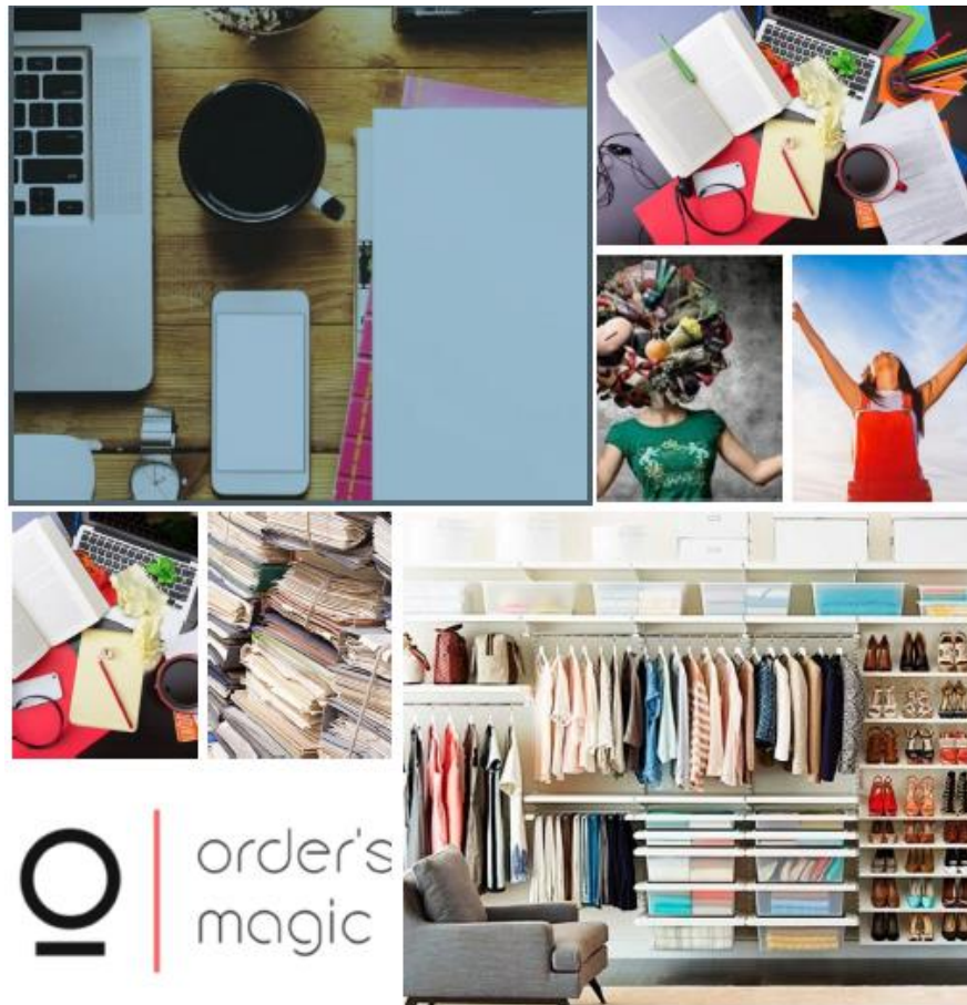
Ilustración 3, Elaboración propia