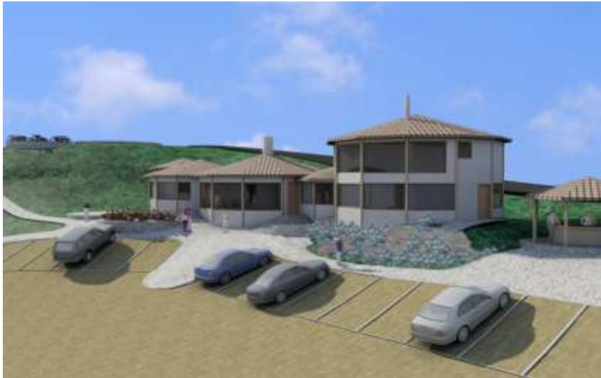
Figura 2. Diseño Arquitectónico

EL MOLINO RESTAURANTE BAR tendrá capacidad de 250 personas de capacidad instalada y una zona de parqueo para 80 carros.