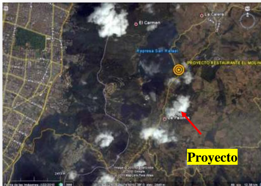
Figura 1. Localización Geográfica.

El proyecto está localizado sobre la vía a la Calera, Km 8 después del peaje.