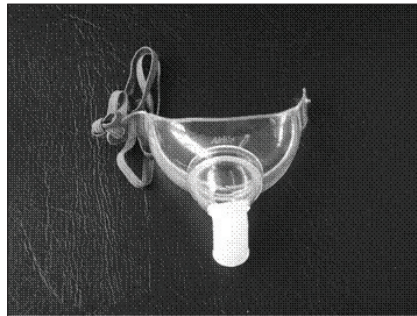
Figura 5. Ejemplo de tienda de traqueostomía