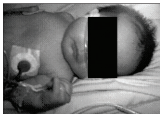
Figura 2. Ejemplo de cánula nasal