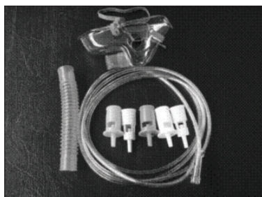
Figura 4. Ejemplo de equipo Ventury