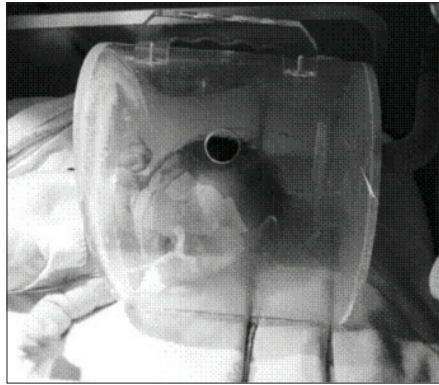
Figura 6. Ejemplo de equipo Oxihood