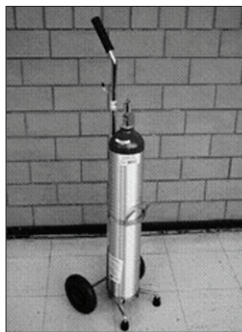
Figura 1. Balas de oxígeno