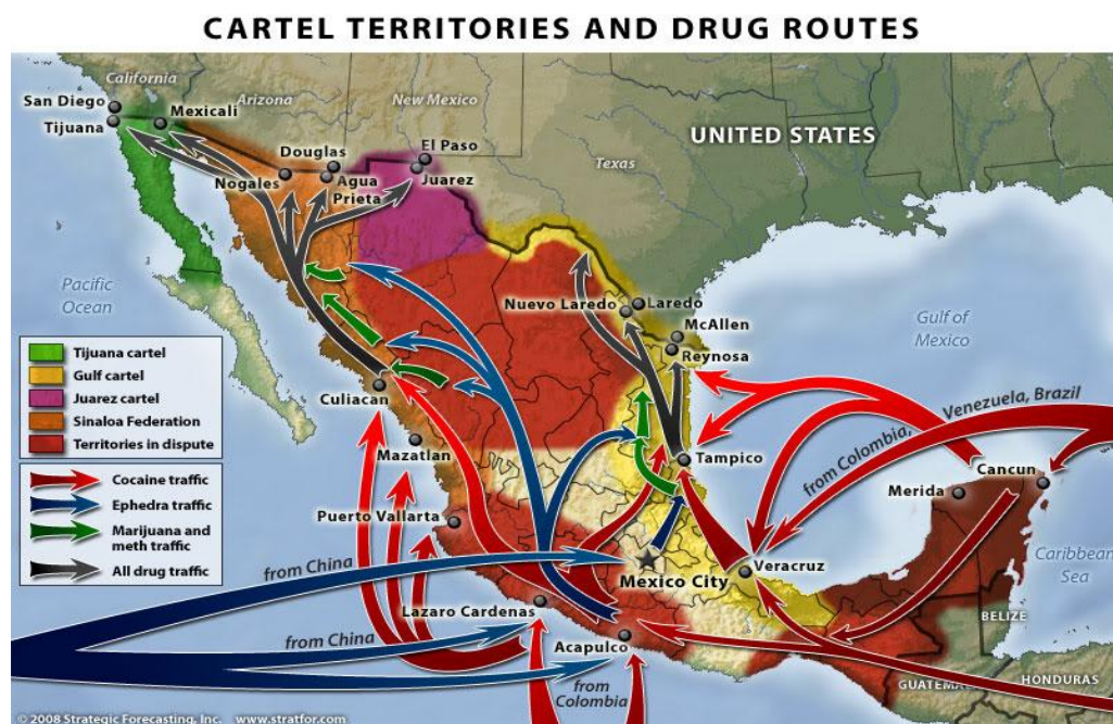
Mapa 1. Territorios de los carteles y flujos de las drogas. 34

Burton, Fred y West, Ben. When the Mexican Drug Trade Hits the Border . (2009). Documento electrónico.