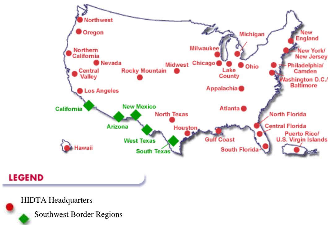
Mapa 2. Áreas de Alta Intensidad de Tráfico de Drogas / High Intensity Drug Trafficking Areas. 51