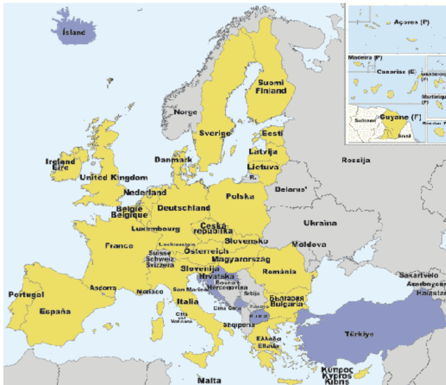
Mapa 3. La Unión Europea