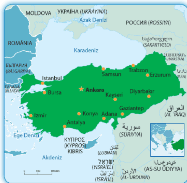
Mapa 1. Turquía