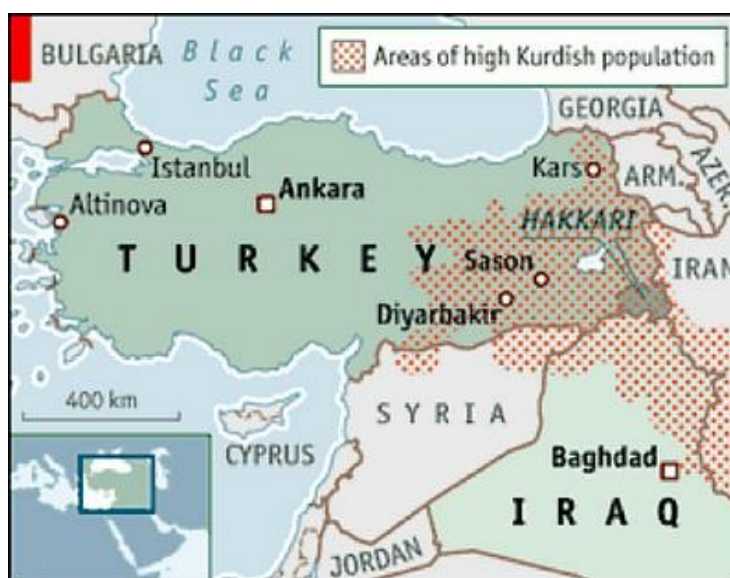
Mapa 4. La población kurda en Turquía.