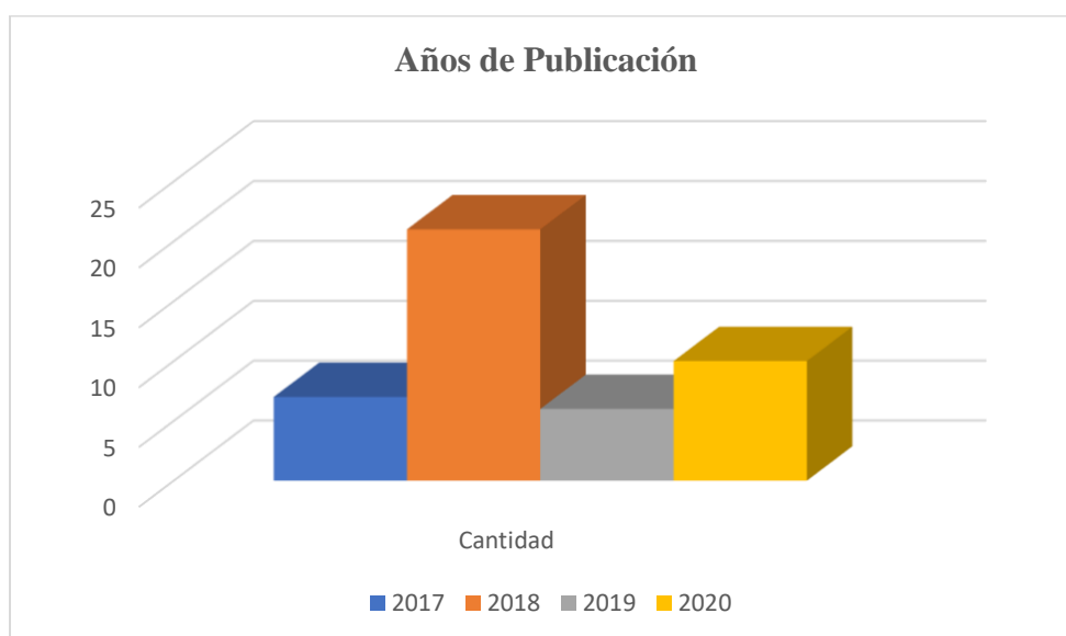
Figura 2. Expone los años de publicación de los artículos elegidos para la investigación.