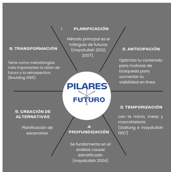
Gráfica 2. Elaboración propia basada en Estudios del futuro: teorías y metodologías (2023)

Al aplicar este enfoque en la producción de un podcast es posible la inclusión de múltiples interpretaciones de la realidad a partir de los relatos de quienes participan en el podcast, los cuales no se basan exclusivamente en los datos empíricos.