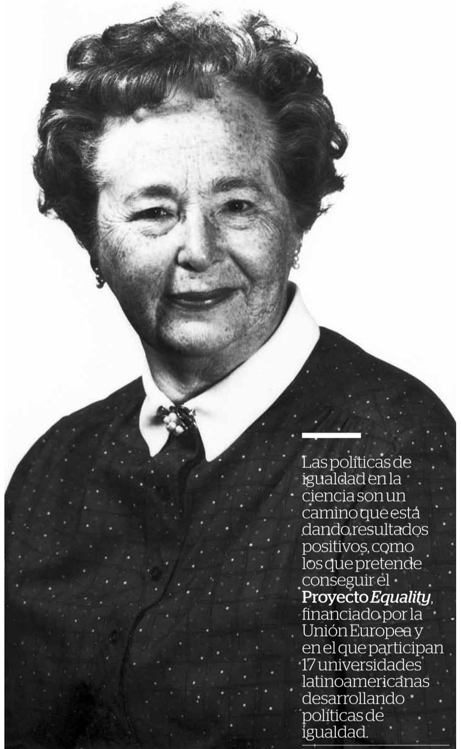
Gertrude Elion, Premio Nobel de Medicina.

Las políticas de igualdad en la ciencia son un camino que está dando resultados positivos, como los que pretende conseguir el Proyecto Equality , financiado por la Unión Europea y en el que participan 17 universidades latinoamericanas desarrollando políticas de igualdad. Estas políticas son necesarias porque no aprovechar la inversión educativa en mujeres es desperdiciar recursos humanos y económicos, y también porque mejoran el bienestar de toda la sociedad: los países más igualitarios están mejor posicionados en la sociedad del conocimiento y presentan mejores indicadores de bienestar.