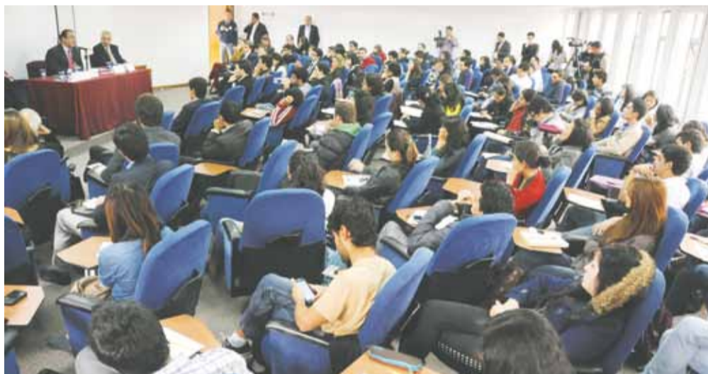
Foro: “Oportunidades y retos del acuerdo comercial entre la Unión Europea y Colombia”

Los conferencistas invitados al Foro fueron Sergio Díaz-Granados, Ministro de Comercio, Industria y Turismo y María Antonia Van Gool, Embajadora de la Unión Europea en Colombia. Adicionalmente, en el evento se hizo la presentación del Diplomado: “TLC con la Unión Europea: herramientas prácticas para un relacionamiento comercial integral”.