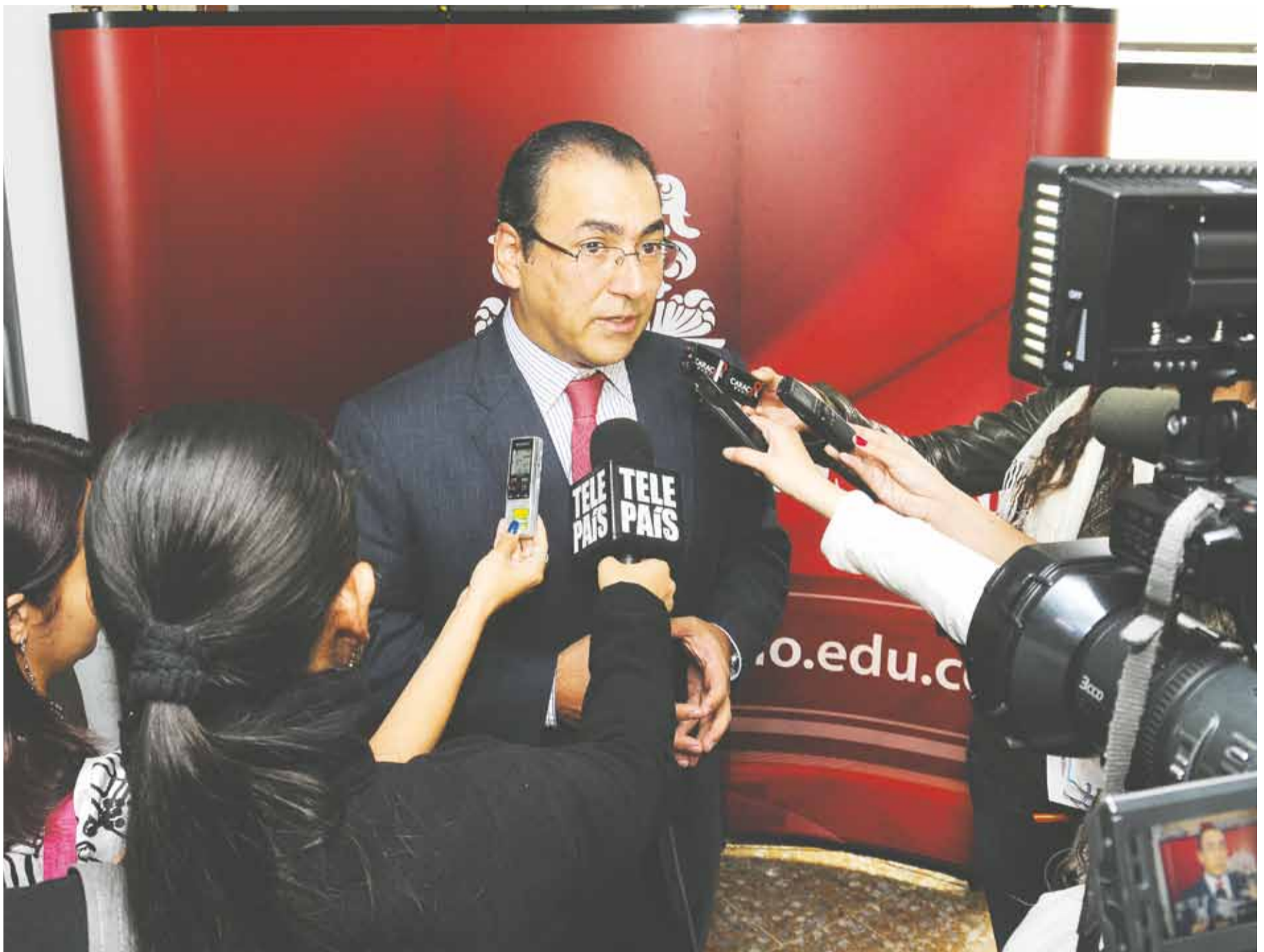
Sergio Díaz-Granados, Ministro de Comercio, Industria y Turismo.

El pasado 5 de marzo se llevó a cabo el Foro: “Oportunidades y retos del acuerdo comercial entre la Unión Europea y Colombia”, en éste el Ministro de Comercio,