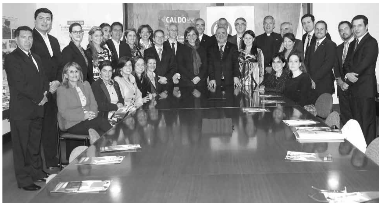
Suscripción convenio de cooperación CALDO – CCYN. Ministerio de Educación Nacional.

La suscripción de este convenio es una muestra de la importancia que ha venido tomando CCYK, a nivel regional, en la promoción de Colombia como destino de educación superior de calidad y en el establecimiento de redes de cooperación para el posicionamiento internacional de las instituciones que lo conforman. En este sentido, el convenio con CALDO es una alianza estratégica que permitirá avanzar en el fortalecimiento de la investigación y en la calidad de la educación.