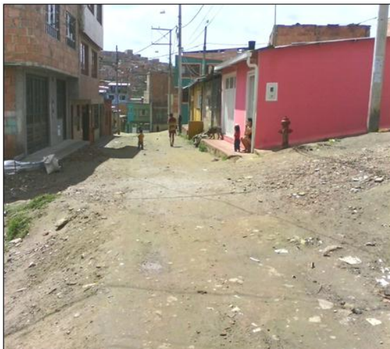
“Mujeres y niños”. Bogotá, 2015.