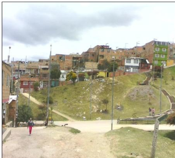
“Mujer sola” Bogotá, 2015.

Entre más viajes se hacen hacia el mismo lugar, el paisaje, el tiempo de recorrido y todo lo demás empieza a parecer más “familiar”, con algunas variaciones en los olores, o la cantidad de gente por recorrido. Sin embargo, no deja de asombrarme la extensión de Bogotá: sólo la localidad de Ciudad Bolívar es más grande que varias ciudades de la zona del país donde crecí (el “eje cafetero”).