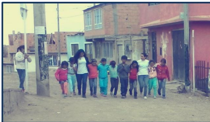
“Cantando”. Bogotá.

Las sesiones que hacíamos cada 15 días con ellos tenían en general la siguiente estructura: 1) un “rompe-hielo” 23 para conocernos y para que los niños entraran en la dinámica de las actividades; 2) una recapitulación de las conclusiones de la sesión anterior enfocada a las preguntas de los objetivos de cada módulo de trabajo 3) la realización de las actividades lúdicas, y 4) un cierre que –en nuestro caso- solíamos hacer con una canción que inventamos relativa a la paz y a la participación de los niños en Somos CaPAZes .