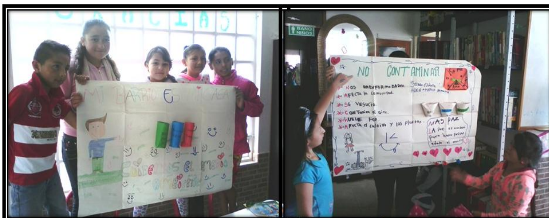
“Reciclemos 1” y “Reciclemos 2”. Bogotá, 2015.

Como voluntaria y como visitante (no habitante), la percepción que me llevaba del aspecto físico del barrio era la de calles siempre sucias, sin pavimentar, parques sin niños, incluso ratas muertas a pocas calles de llegar a la fundación. Los niños por su parte, en una de las pedagogías lúdicas que realizamos, debían responder entre todos algunas preguntas: 1) ¿Con qué palabra definirías tu barrio? A lo que contestaban en principio con aspectos negativos: inseguridad, suciedad, etc; sólo hacia el final concretaron que AMISTAD era la palabra que definiría su barrio. 2) ¿Cómo hacer de mi barrio mi casa? Coincidieron en que el barrio necesitaba más campañas de reciclaje, más seguridad; usamos esas inquietudes para que ellos mismos incentivaran una campaña de reciclaje y limpieza.