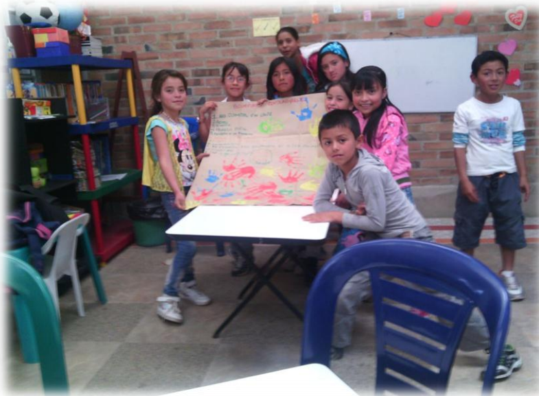
“Acuerdos comunitarios”: Bogotá. 2015.

al final ponían sus manos como una firma en la cartela de los acuerdos con el fin de generar en ellos una apropiación de lo que estaban escribiendo.