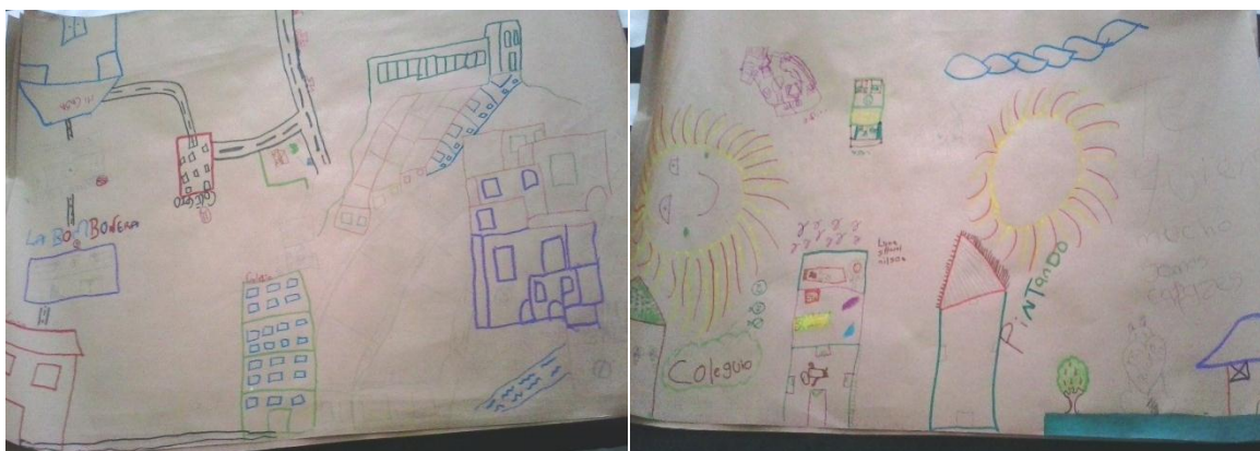
“Cartografiando el barrio”: Bogotá. Fotografía por Juliana Mejía, 2015

Sin embargo, para esta actividad se complementó el dibujo con dos actividades: 1) se les pidió ubicar una cara feliz en los sitios donde se sintieran bien (coincidieron en poner la casa de cada uno), una triste donde se sintieran mal (coincidieron en ponerla en el colegio), y una X donde se presentaran más conflictos (aquí hubo varios sitios: el parque, el patio del colegio, la zona superior del barrio, “detrás de su casa”), varios de los relatos daban cuenta de cómo el parque está generalmente habitado por jóvenes que empiezan actos violentos, o comercian con drogas. Les preguntamos entonces qué tanto se presentaban peleas allí, y nos decían que “lo regular”, respuesta que da cuenta de cómo se llegan a normalizar situaciones cuando son recurrentes en un mismo contexto.