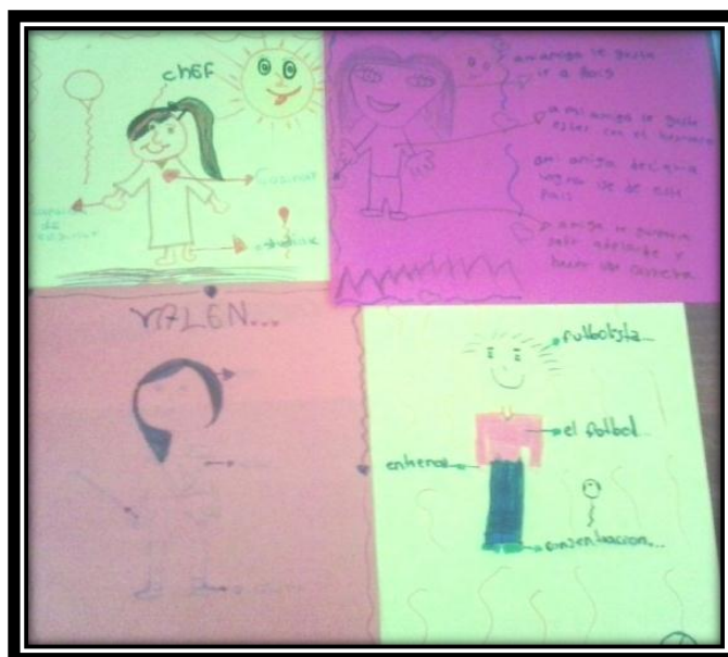
“Quiero ser...”: Bogotá. Fotografía por Juliana Mejía, 2015

Dicha actividad tenía como objetivo que los niños vieran cómo al tener claras sus metas, la propensión a la violencia puede disminuir, ya que están en capacidad de visualizar aquellos elementos positivos que los puede llevar a alcanzarlas; y cómo en unión con sus compañeros pueden hacer uso de ese capital social para estar más cerca de la realización de esas metas sin acudir “al camino fácil”.