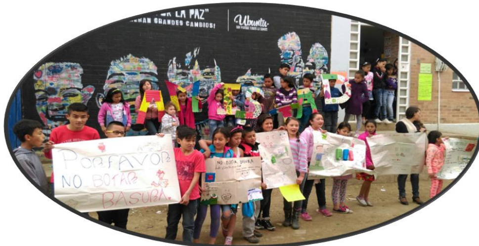
“Amistad”. Bogotá, 2015.

Empoderarlos con soluciones que hagan frente a lo que ellos mismos evidencian como problemático les da herramientas para empezar a ser críticos frente a su cotidianidad. Aun así, en todas las actividades que realizamos a lo largo del programa la referencia al barrio fue negativa.