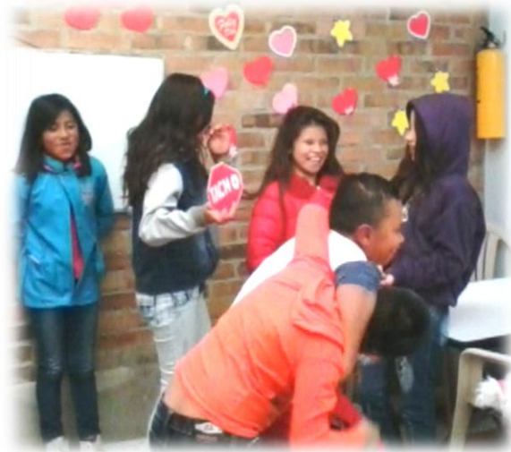
“Tacho”: Bogotá. Fotografía por Juliana Mejía, 2015

Al final, discutimos con ellos “la importancia que entre nosotros mismos controlemos nuestras acciones y reprochemos aquellos que impidan que seamos una comunidad CaPAZ ” 33 , una vez socializado esto los niños eran más críticos frente a cómo y cuándo intervenir en un conflicto. Esto refuerza la tesis según la cual “los niños desarrollan una comprensión de por qué es importante ser justo y tratar a los demás igual. Como uno se identifica con otro, entonces esto se convierte en la fuente para entender por qué se equivocó al infligir daño o negar los recursos de los demás” (Killen & Rutland, 2011, pág. 20). En últimas, el juego ayuda a ver el reconocimiento como una herramienta clave para combatir las violencias.