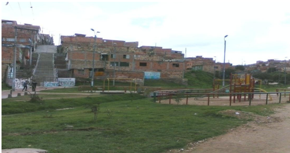
“Parque sin niños”. Bogotá, 2015.

El barrio Potosí es una muestra más de lo que se podía ver en el recorrido hasta allá: calles sin pavimentar, basura en las calles, sin uniformidad entre las construcciones, las viviendas sirven tanto de lugar de residencia como de trabajo (tiendas, restaurantes de barrio), etc., Ese primer sábado, llegamos a las nueve de la mañana, todo estaba muy solo, el parque sin niños, las calles sin gente. Al devolvernos esto cambiaba un poco.