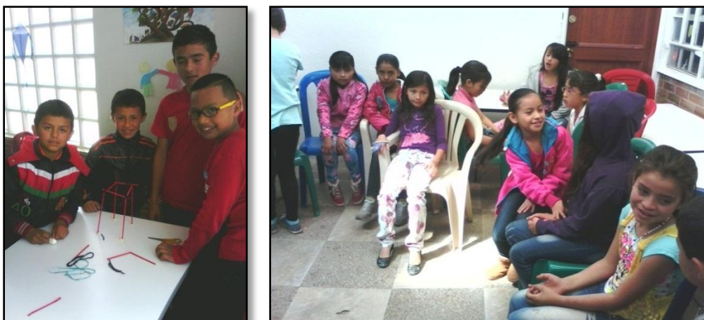
“En grupo 1” y “En grupo 2”, Bogotá.

Otro ejemplo de las reglas implícitas en cómo los niños formaban sus grupos, era que solían quedar divididos entre niñas y niños por aparte, tal y como se muestra en las siguientes fotografías: