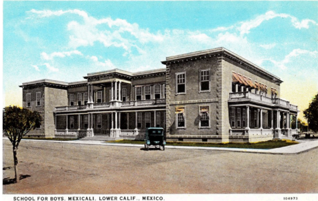
Figura 3. Escuela Cuauhtémoc, inaugurada en 1916