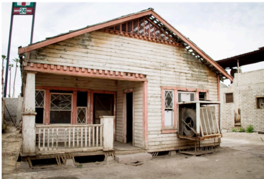
Figura 4. Vivienda ubicada en la Primera Sección antes de ser incendiada

4 El censo de población y vivienda del 2010, da como resultados absolutos 749,320 habitantes a nivel urbano y 936,826 habitantes en todo el municipio.