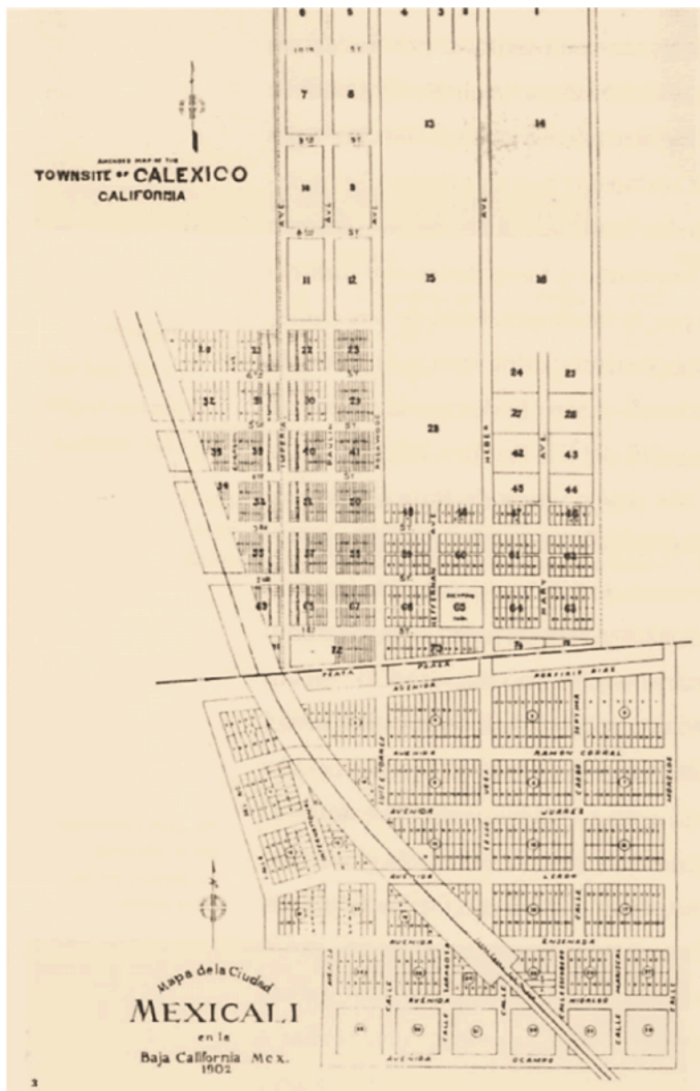
Figura 1. Mapa de las ciudades espejo Mexicali-Calexico