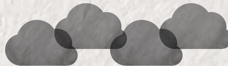
Emisiones de CO 2

Todos los procesos logísticos que realizan las organizaciones tienen un impacto en el medio ambiente