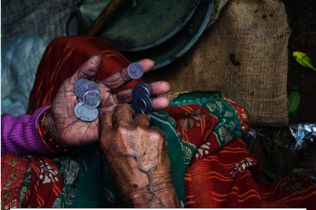
La epistocracia supone una desigualdad social; solo los que tuvieron mayores oportunidades educativas y económicas se posicionarían como el grupo idóneo para tomar las decisiones.

Tal vez ha sido el pensador colombiano Estanislao Zuleta quien lo ha dicho con más claridad: la democracia es frágil: “Es muy fácil elogiar la democracia, pero es muy difícil aceptarla en el fondo, porque la democracia es aceptación de la angustia de tener que decidir por sí mismo.” (Zuleta, 2016, 90). Ya mucho antes de Zuleta lo había dicho Kant en su famosa “ Respuesta a la pregunta ‘¿qué es la ilustración?’ ” cuando hablaba de la ilustración como una mayoría de edad, pero no una mayoría de edad meramente cronológica, sino del uso de la razón. Ser mayor de edad, para Kant, era atreverse a pensar por sí mismo, sapere aude , como rezaba la consigna en latín. Y la ilustración adolecía de la misma fragilidad que la democracia y por las mismas razones: