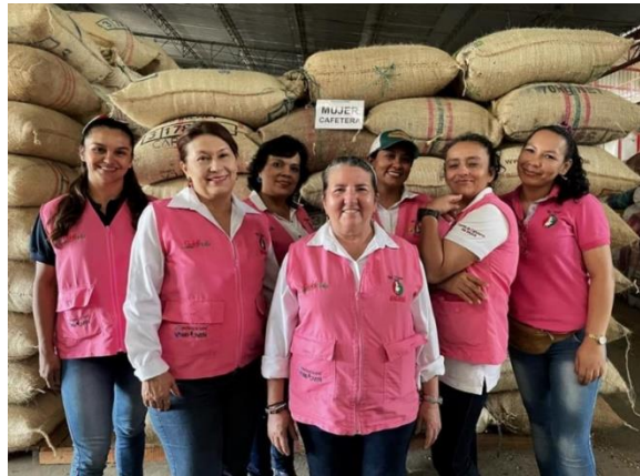
Imagen 2. Mujeres pertenecientes a la Asmucaocc. Julio 2021

la afiliación a una asociación para permitir una entrada a los eslabones fundamentales de la cadena agroalimentaria, es decir, de la comercialización, de los insumos y la industria, que les permitan mejorar su calidad de vida. La importancia de la figura de la asociación a nivel institucional resulta fundamental, no obstante, también he podido evidenciar que no solo es este el valor agregado de pertenecer a la ASMUCAOCC sino que también se ha convertido en un espacio donde estas mujeres van a divertirse, distraerse de las responsabilidades de “todos los días”, donde han encontrado amigas, maestras, compañeras, donde han aprendido y han disfrutado el ser mujeres cafeteras.