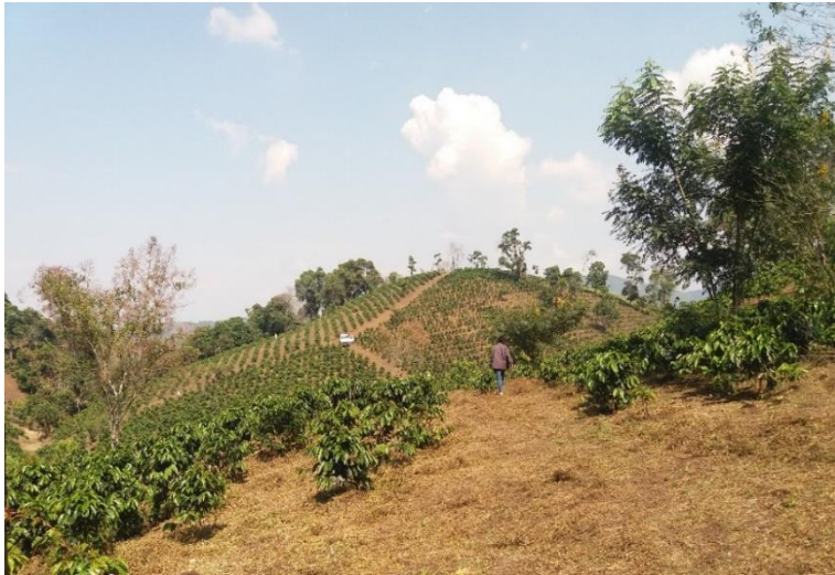
Imagen 1. Cultivo de café de Marisol. Septiembre 2019