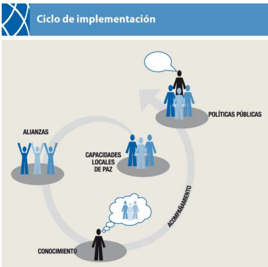
Gráfico 2. Estrategia Art Redes.