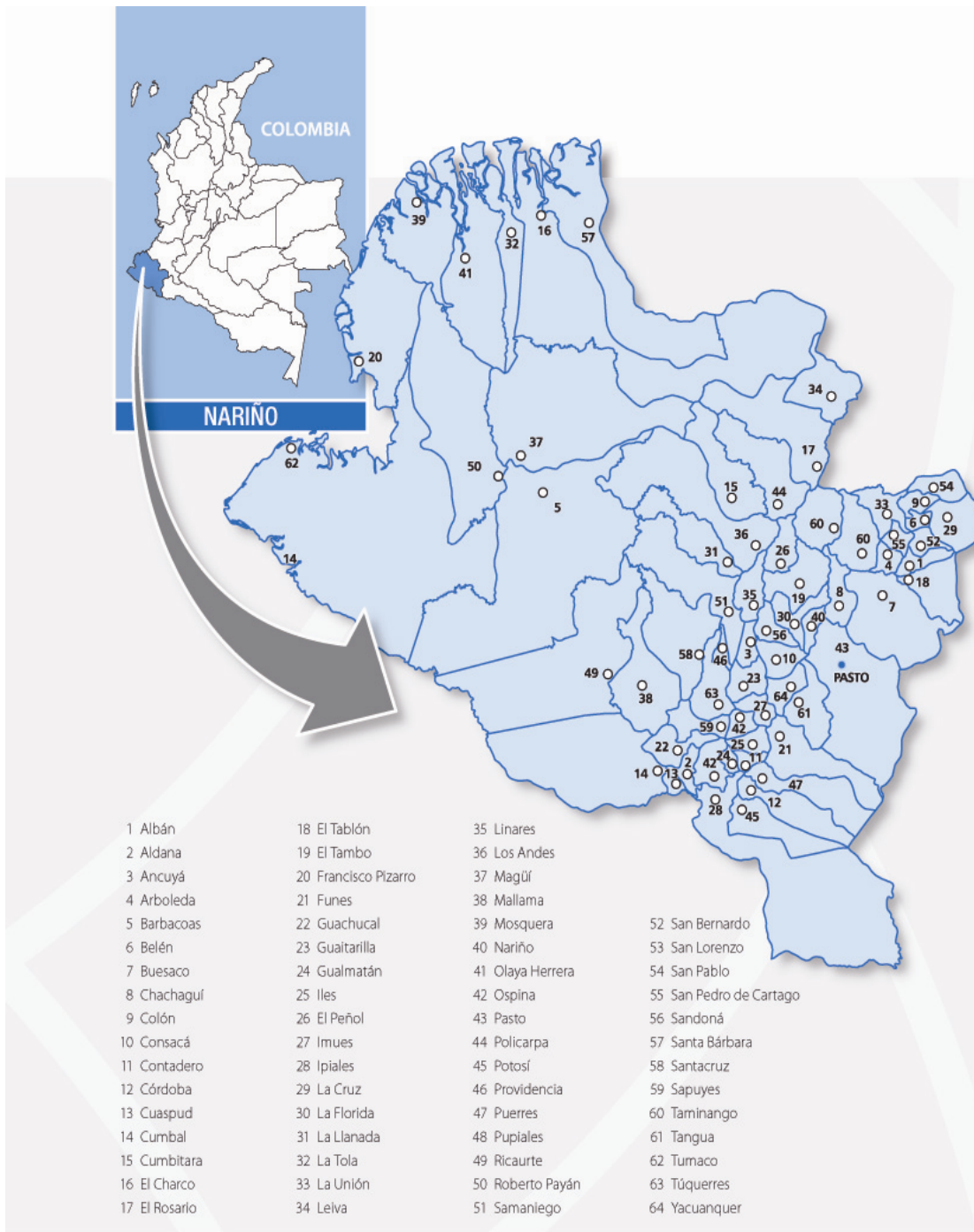
Gráfico 1. Mapa de Nariño.