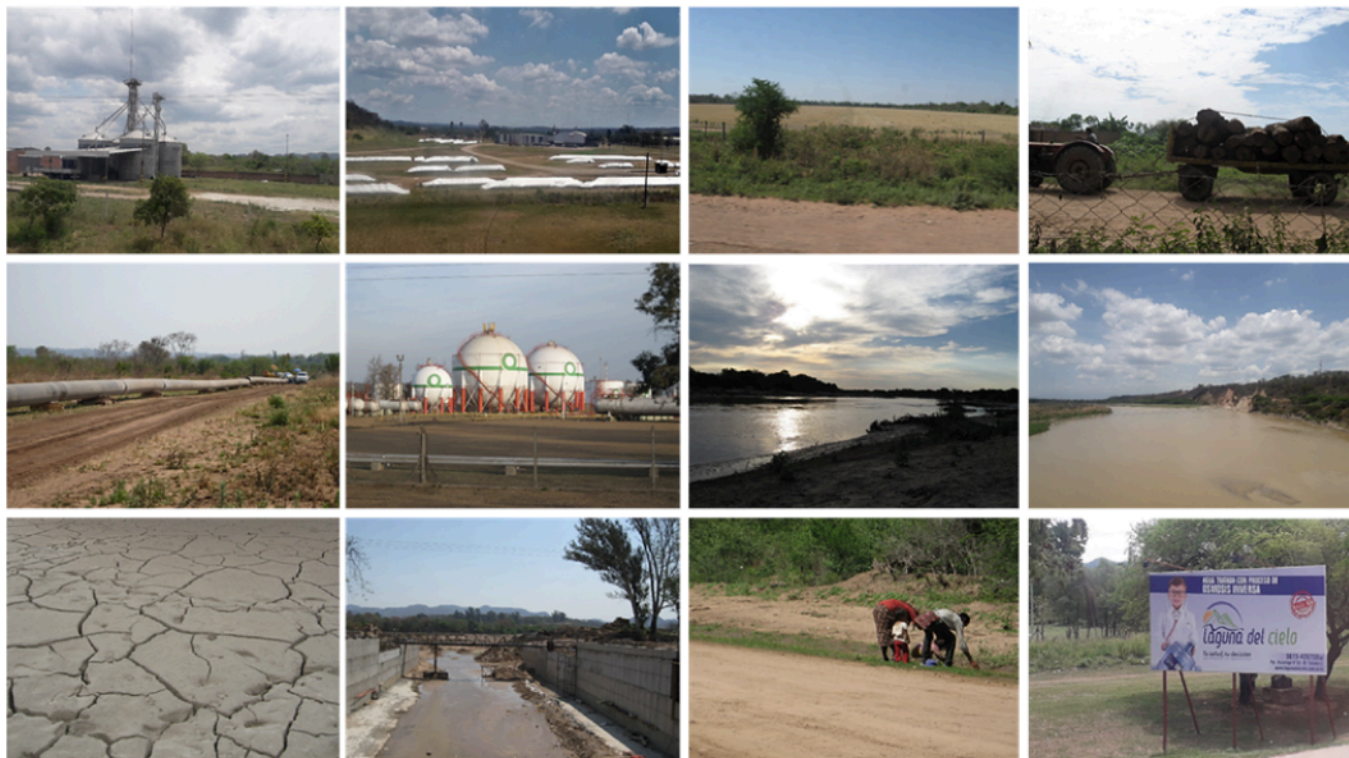
Figura 1. Chaco salteño, territorio hidrosocial