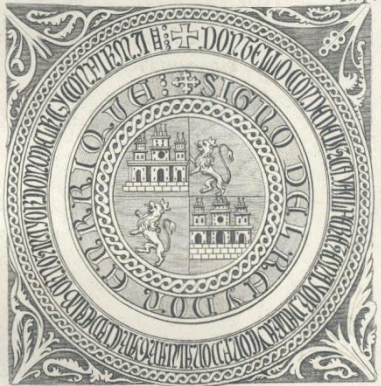
Sello de los Plomos pendientes de los Privilegios de los Reyes Catholicos. A. o 1484.