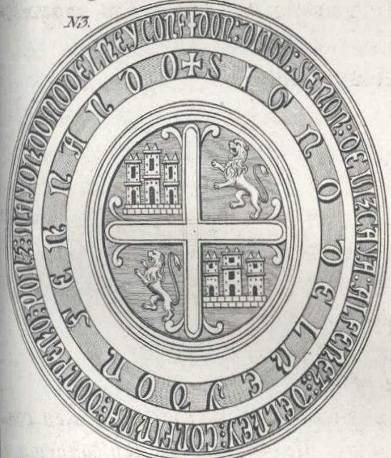
Stillo de un Privilegio Rodado del Rey Fernando IV. Año 1342.