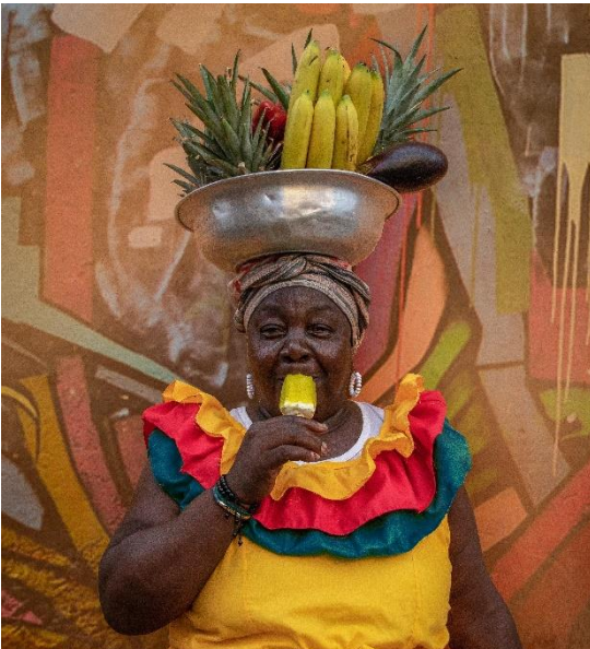
La Ley 2125 de 2021 incentiva la creación y formalización de empresas lideradas por mujeres.

Es importante señalar que dentro de las propuestas interesantes de esta ley, está la visa a extranjeros para trabajo remoto –nómadas digitales–, la implementación de la contabilidad simplificada para microempresas, el seguro MIPYME para proteger las inversiones o financiación de los emprendimientos y el crowdfunding 10 .