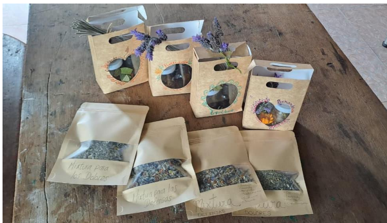
Imagen 8 Mixturas, bálsamos y lavanda del kit herbal.

Ahora bien, reconocer la heterogeneidad de los asistentes en los talleres también se ve reflejado en las instrucciones: “las proporciones y cantidades para preparar las mixturas varían en su medida dependiendo de cada uno, ya que según Vanessa son de acuerdo con ‘la perfecta simetría del cuerpo’. Cada uno participa en trillar y mezclar de manera conjunta. Sin embargo, individualmente nos servimos nuestras propias medicinas, puesto que eso lleva la energía de cada uno” (Nota de campo, 14 de diciembre 2024). El desarrollo de un sentido de lo común ocurre paralelamente con los intereses individuales, y se comienzan a articular, incluso en medio de diferencias. En la construcción de comunidad conviven las tensiones de lo individual con la configuración de una “lógica común que convierte una gran parte de los objetivos e intereses más o menos particulares en asunto colectivo porque son así más fácilmente realizables” (Ruiz-Ballesteros, 2015, p. 28).