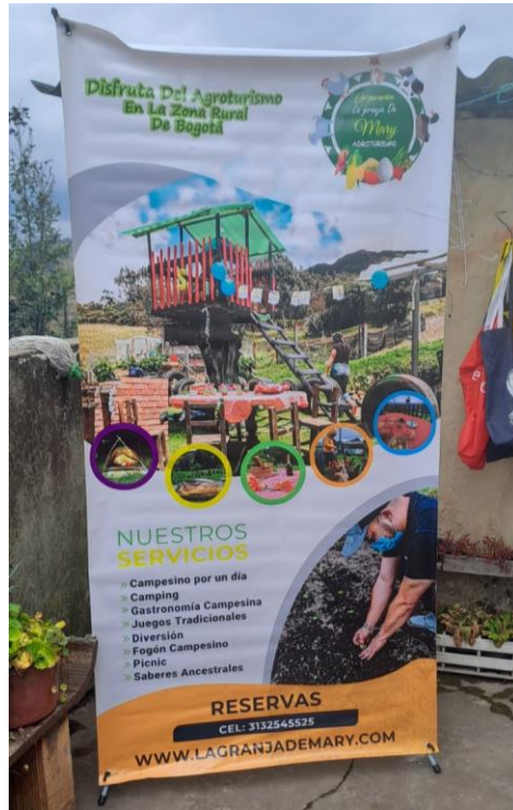
Imagen 9 Afiche de promoción Granja de Mary en el mercado campesino.

Ahora bien, la capacidad de conciliar los conflictos y encontrar espacios de cooperación y competencia sana también son posibles. Ese es el caso de La Granja de Mary , una iniciativa que inicia en el 2018, y que tiene un enfoque centrado en el agroturismo. Con base en las labores del campo que su dueña aprendió de su madre campesina, ofertan experiencias de “ser campesino por un día”, talleres de alimentos como la leche, un tobogán jabonoso, etc. (Imagen 9)