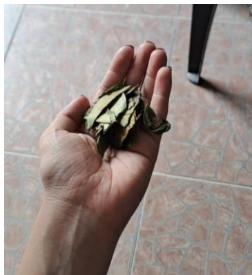
Imagen 5 Un puñado de Hayo.

Primero pasa ella con una bolsa llena de hoja de coca y nos da un puñado a cada uno, no son dos o tres hojas, “es la cantidad que sale para cada persona” (Imagen 5). Me lo entrega y comienzo a mascar. Luego pasa Sebastián con un pequeño tarro de spray y en las manos nos pone de este, frotamos nuestras palmas y luego inhalamos, ya que esto ayuda para la respiración y para conectar con el aquí y el ahora. (Nota de campo, 09 de febrero de 2025)