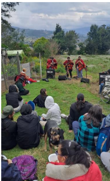
Imagen 6. Presentación grupo música andina. Fuente propia (2025)