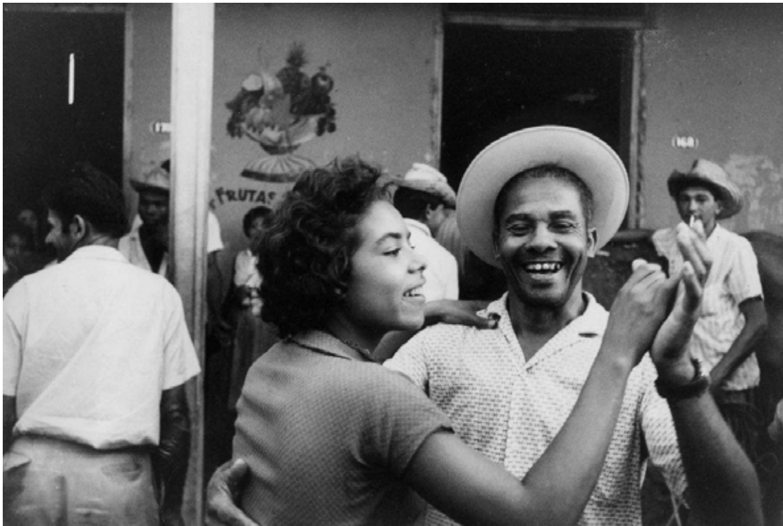
Imagen del documental Salut Les Cubains . (1963). Dirección: Agnès Varda. Nota.

[...] hay una dimensión temporal significativa en un experimento, porque supone una acción que se desarrolla en el tiempo. De aquí se deduce que aquello que ha sido llamado «experimental» en el ámbito audiovisual ha estado vinculado a cierta disposición empírica de las herramientas de expresión. Para Turquier (2008) aquello que define una práctica experimental es su vocación subversiva e innovadora, así como el establecimiento de una regla de acción que permite una experiencia material, un ensayo de posibilidades plásticas, gráficas, narrativas, sonoras. (2018)