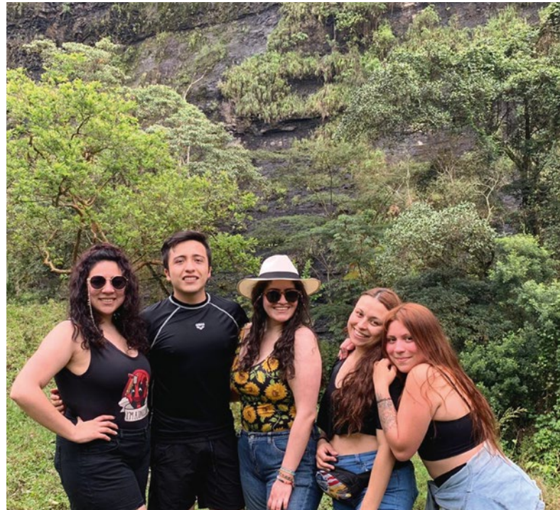
→ Buenos momentos con amigos de la Universidad.

Inicialmente tuvo conflicto al ingresar a la universidad, pues creía que al venir de una clase media-baja estaba en desigualdad de condiciones e intencionalmente miraba a todos mal para que no se le acercaran. “Entrar a la Escuela de Ciencias Humanas me ayudó a cambiar los estereotipos que tenía, pensé que todas las niñas iban entaconadas, maquilladas y con bolso, pero encontré gente como yo, que tomaba trago barato como todos