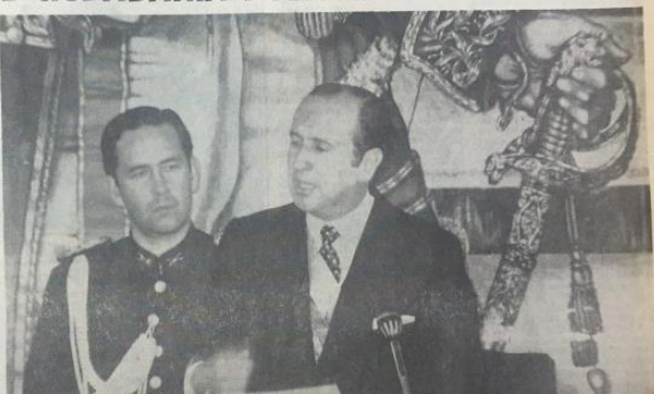
En el Salón Elíptico del Capitolio Nacional, el doctor Misael Pastrana Borrero aparece pronunciando su discurso de posesión como presidente de la República, después de prestar juramento. Al lado del jefe del Estado está el teniente coronel Álvaro Arenas. En la gráfica se destaca un detalle del monumental fresco del "Congreso Admirable de Cúcuta", que adornó el Salón Elíptico, donde el presidente Pastrana Borrero anunció el mandato ante el Congreso de la República en pleno y las numerosas delegaciones acreditadas del exterior para este acto.

EL ESPECTADOR trabajará en bien de la Patria con criterio liberal, y en bien de los principios liberales con criterio patriótico. - FIDEL CANO 24 PAGINAS - 3 SECCIONES - $ 1.00 Bogotá, D. E. Sábado 8 de Agosto de 1970 VENEZUELA —Un estudio sobre Venezuela a una subcomisión para en las conversaciones con Venezuela sobre la paz y la estabilidad económica. ACCION INMEDIATA —El programa de acción inmediata comprende el estudio, la salud, la educación, la seguridad y la recreación. LA OPOSICION —El Gobierno se ve envuelto en una gran batalla política y organizativa. Para ser más firme y estable contra los ataques y calumnias de la oposición, el doctor Pastrana... REFORMA AGRIARIA —La reforma agraria debe ser complementada de la reforma agraria. Se hará un estudio sobre los campesinos contra todos los riesgos. ELECCION DE PRESIDENTE —Se adelantará una campaña de propaganda para la elección de presidente, para adaptar al pueblo a la idea de la presidencia de la República, como los que se hicieron en Francia. (Véase texto en páginas 12A y 12B)