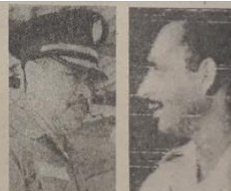
General JUAN ALBERTO MELGAR CASTRO, presidente derrocado. General POLICARPO PAZ GARFAJA, quien encabezó el golpe.