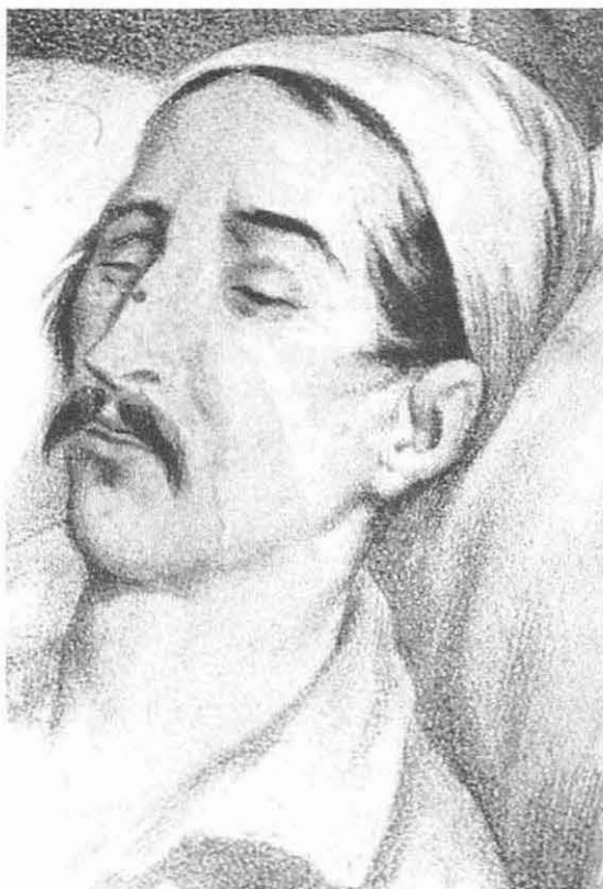
Luis García Hevia, Santander en su lecho de muerte, detalle, óleo. Museo Nacional. Bogotá

En tercer lugar, las naciones se desarrollan en los sistemas-mundo