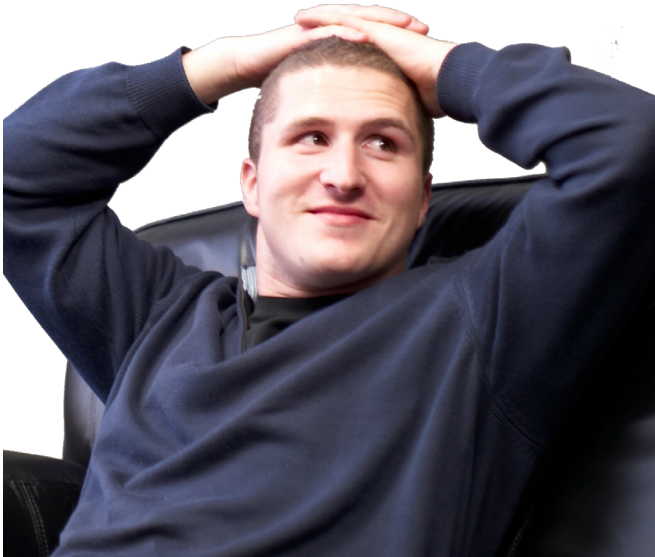
Shawn Fanning escribió el código Napster, uno de los primeros programas de popularidad masiva p2p.

Un día de enero de 1999, luego de extensas jornadas de trabajo en su Apple Macintosh, el joven abandonó sus estudios y se refugió en la oficina de su tío por varios meses. Allí