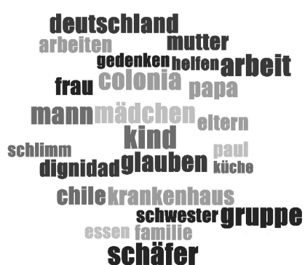
Gráfico 2: Nube de Palabras (presentación propia creada con MAXQDA y basada en 14 entrevistas del archivo online CDOH)

El siguiente paso fue la primera exploración de los textos para poder seleccionar las seis entrevistas individuales que a continuación se iban a analizar en detalle. Para identificar palabras y