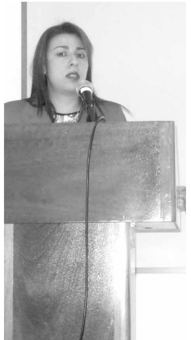
Mónica Mejía Arenas, Procuradora Delegada para el Juzgado 13 Penal Municipal de Conocimiento.

Finalmente, quedó la reflexión de la importancia de dominar este tema para los estudiantes de Jurisprudencia en el Área Penal, quienes en el futuro, en su labor como defensores, se deberán enfrentar ante casos en los que los jueces se pueden equivocar; de ellos depende la defensa de los acusados y la representación de las víctimas para que el juez pueda tomar la mejor decisión.