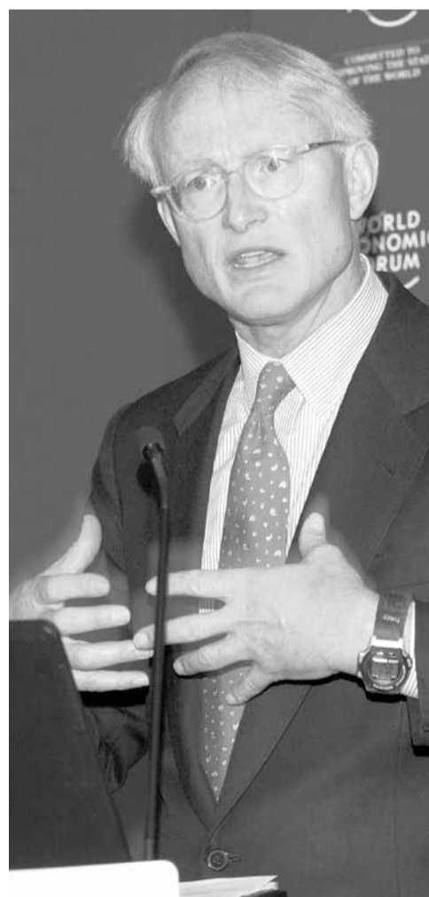
Michael Porter, profesor del Harvard Business School .

Ésta fue diseñada con el propósito de formar estudiantes egresados en negocios, economía, desarrollo, gobierno y disciplinas relacionadas. Actualmente, la red cuenta con 90 universidades afiliadas en el mundo, de las cuales en Colombia se encuentran: la Universidad de los Andes, la Pontificia Universidad Javeriana, la Universidad Nacional y, ahora, la Universidad del Rosario.