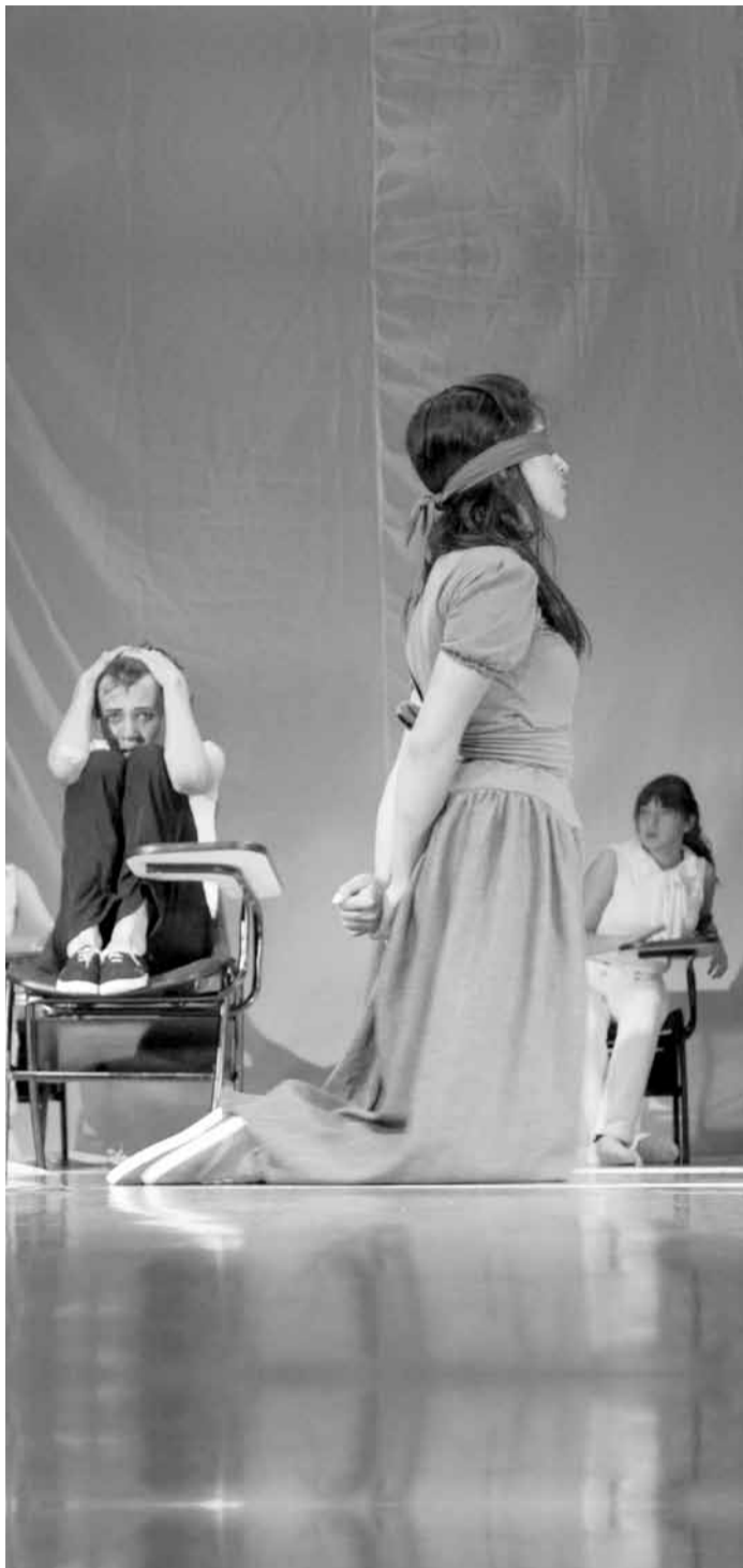
Obra: Del silencio al grito.

Se espera que "Ensamble Guernica" sea visto por todos los estudiantes de la Universidad y por el público en general.