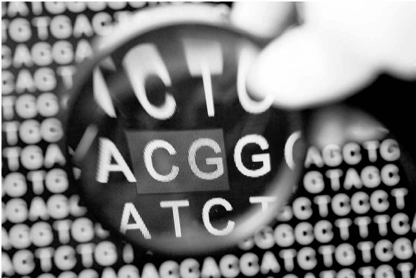
CORTESÍA DEL DOCTOR PAUL LAISSUE.