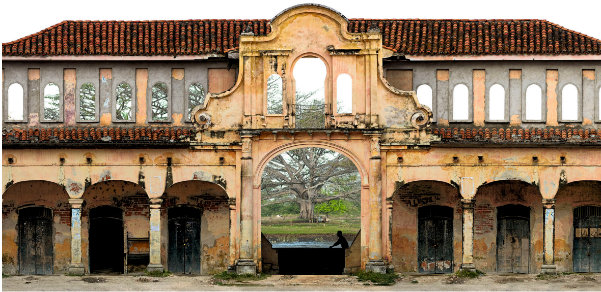
Santa Cruz de Mompox, Bolívar.

Con base en lo anterior se evidencia que efectivamente existe una pérdida paulatina del patrimonio en Mompox, la cual responde a tres causas fundamentales. En primer lugar, es claro que la comunidad no tiene un lugar activo en la planeación y desarrollo de proyectos de restauración, conservación y apropiación del patrimonio mueble e inmueble del municipio. En segundo lugar, no existe una lista actualizada de las manifestaciones de patrimonio inmaterial, entre las que se incluyen los oficios tradicionales, las celebraciones musicales y religiosas, la tradición oral y las prácticas gastronómicas típicas de la región, lo que por consiguiente impide que sea posible emprender proyectos que las posicionen como ejes de desarrollo económico.