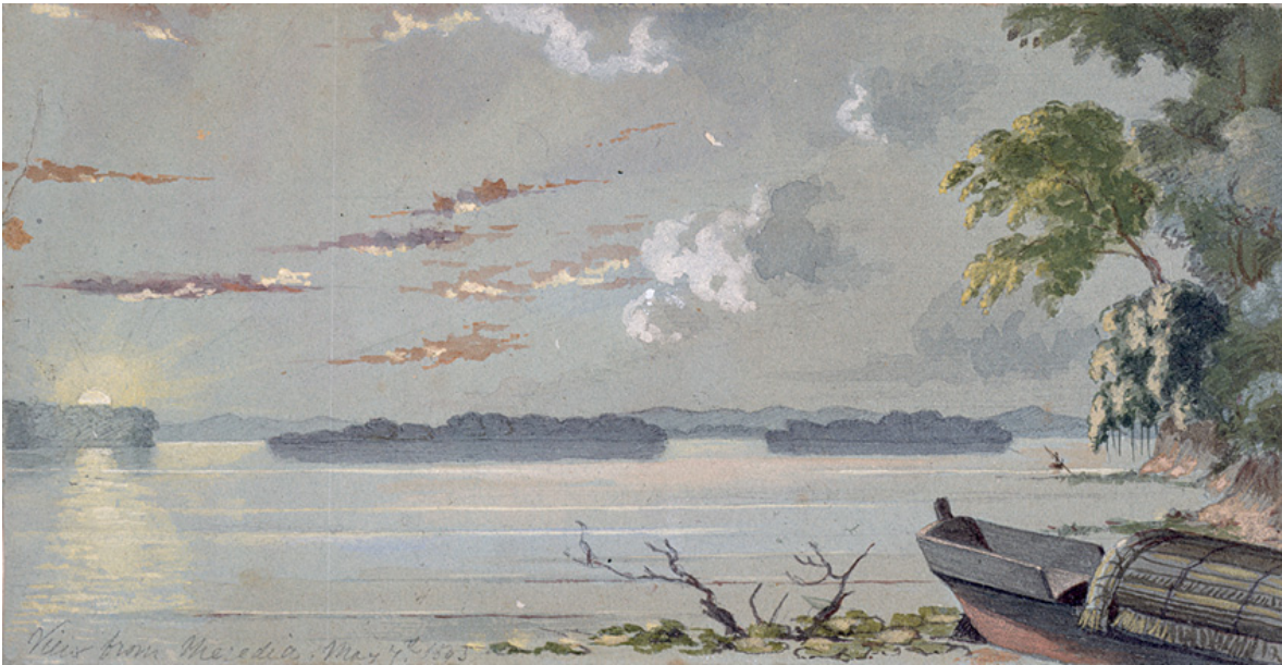
Edward Walhouse Mark. En el Magdalena . 1845. Acuarela sobre papel. Colección del Banco de la República.