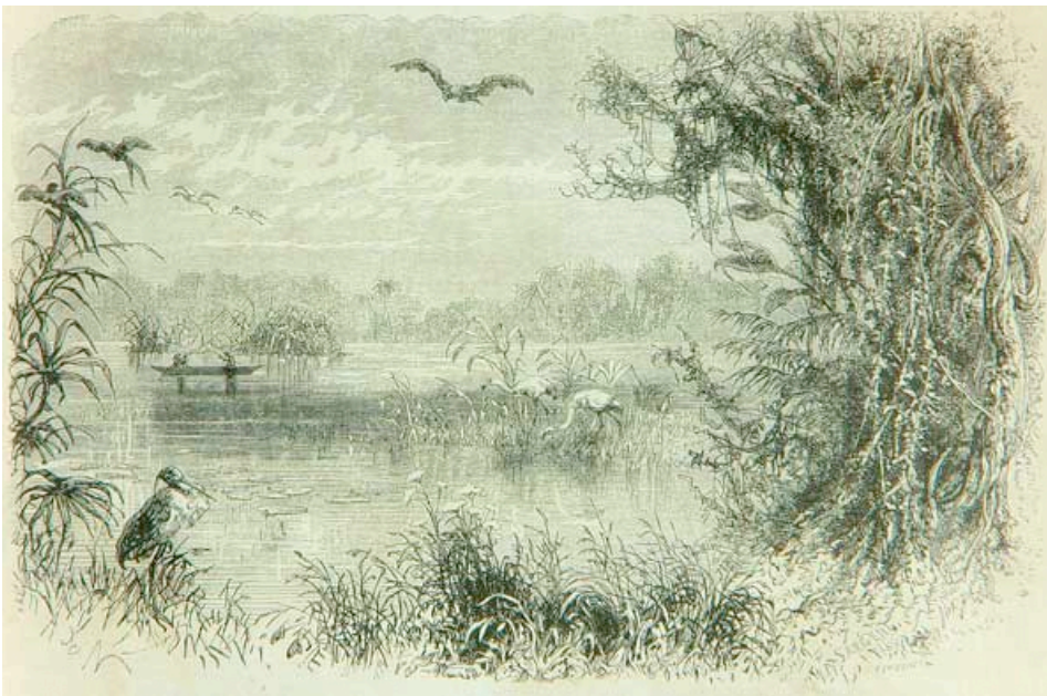
Charles Saffray. Les iles de la Magdalena . s. XIX. Tinta sobre papel. Colección del Banco de la República.

Esta dimensión incluye las ciénagas y pantanos que hacen parte de la geografía del lugar, hábitat de numerosas especies de aves como las garzas blancas, morenas, el pato yuyo o cormorán, los piscingos, el pato mono, los gallitos de ciénaga y las tangas, así como de una serie de anfibios que, aunque también pertenecen a otras regiones de la costa colombiana, aquí conviven con la población del municipio en cuanto a que las actividades de sus habitantes se relacionan de manera directa con el contexto rural del pueblo. 2