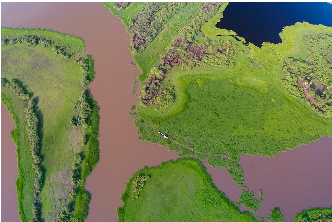
Vista aérea de la Ciénaga de Pijiño, Mompox, Colombia.

Con base en las actividades y los objetivos se desglosa el presupuesto, y se prevén los indicadores para medir el impacto del proyecto en la comunidad y su viabilidad en los demás pueblos patrimonio. El documento cierra con unas reflexiones finales.