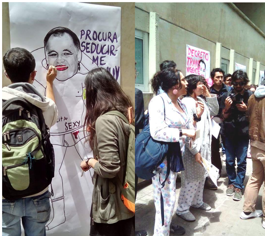
Imagen 5: Plantón contra procurador para evitar que revocara el decreto 1227

A partir de lo anterior, en el 2018 el GAAT junto con FONADE y la Superintendencia de notariado hizo parte de un proyecto de cedulación en Bogotá y Cali. Este contaba con ofrecer servicios de asesoría, financiación y revisión del proceso para lograr la cedulación de alrededor de 200 personas trans que no habían tenido la oportunidad de hacerlo. El objetivo principal era ayudar no solo a facilitar la documentación con el nombre y el sexo correctos en este documento, sino garantizar el cumplimiento del Decreto 1227 a un gran número de personas, facilitar el cumplimiento de sus derechos sin que la cédula se convirtiera en una barrera de discriminación.