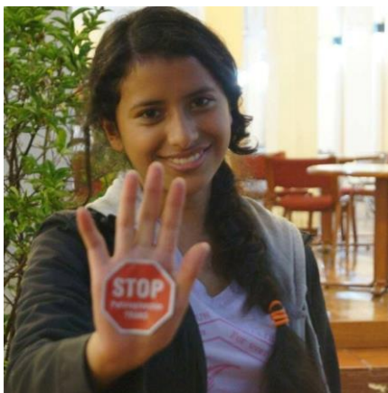
Imagen 1: Campaña “Stop Patologización Trans”

A través de stickers o pegatinas con el símbolo de Stop y con el mensaje de “Stop Patologización Trans” el equipo administrativo del GAAT empezó a difundir el movimiento entre la población de personas trans de la ciudad. Después de los grupos de apoyo el equipo pedía a los simpatizantes y a sus asistentes una foto con el sticker para luego subir cada foto a sus redes sociales a manera de compartir y motivar a más personas a exigir que dejara de verse como una enfermedad o problema médico. Los lugares donde el símbolo de la despatologización estuvo presente, excedieron el espacio de reunión de los grupos de apoyo, pues se aprovecharon marchas, plantones, protestas, eventos académicos e incluso en una de las visitas de Laura a la Universidad del Rosario, se aprovechó para repartir más pegatinas a los estudiantes interesados en saber más acerca del movimiento.