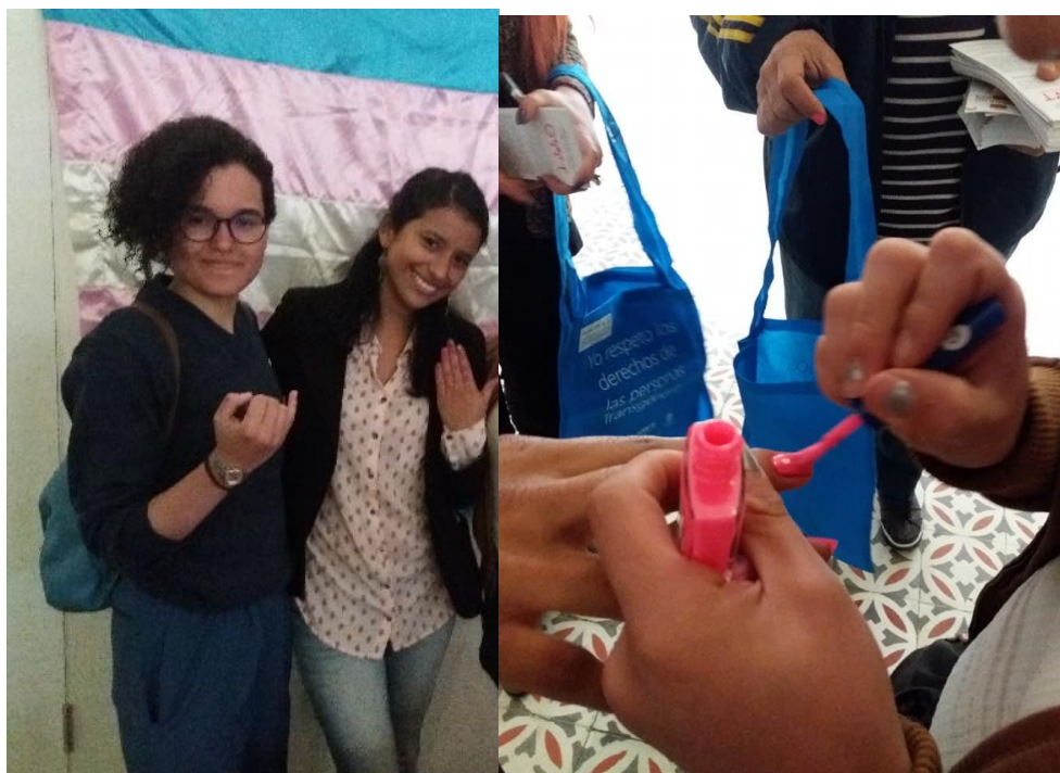
Imágenes 3 y 4: día de la visibilidad trans, celebrado el 02 de abril del 2018 en la Universidad del Rosario