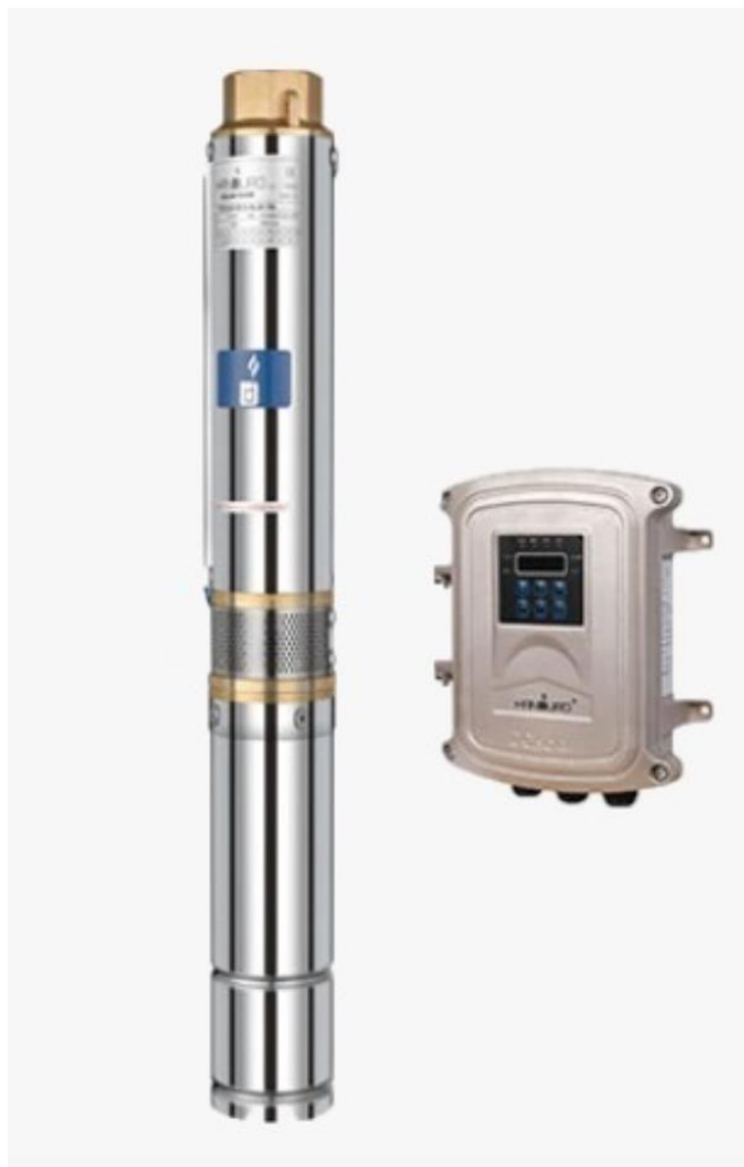
Figura 1 Motor