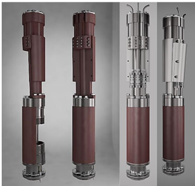
Figura 2 Bomba Electrosumergible

La bomba electrosumergible trae distintos componentes de fondo y componentes de Superficie, los cuales brindan datos precisos acerca de la operación en cada momento.