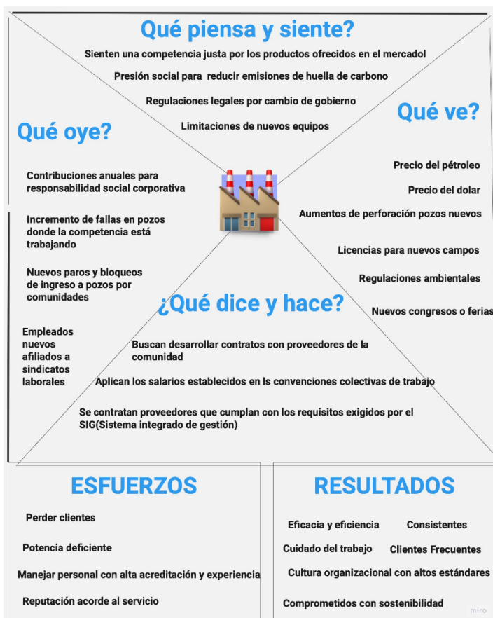
Figura 3 Lienzo de Empatía

Debido a la relevancia de las operaciones implicadas, el tipo de mercado en el cual se desarrolla la prestación de los servicios propuestos a un B2B. Nuestro público objetivo, está orientado a un grupo selecto de empresas que poseen regulaciones ambientales y contratos vigentes con el gobierno nacional para la exploración de áreas a lo largo del territorio colombiano.