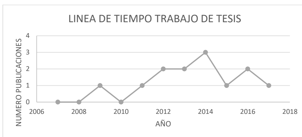
Figura 6. Publicaciones tesis de grado por año.

Por otra parte, en la Figura 6, se aprecia en una línea de tiempo el comportamiento de la producción académica en tesis de grado de pregrado y posgrado en administración en salud en 10 años, donde se observa un crecimiento notable en los últimos 6 años, tomando como base los diferentes programas académicos ofertados en Colombia.