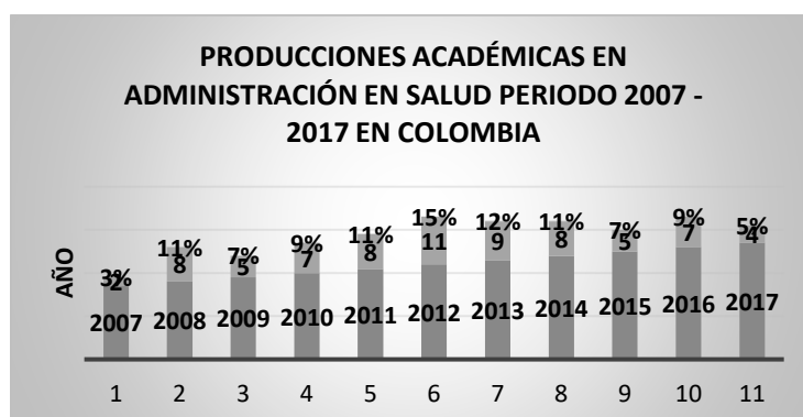
Figura 3. Producciones académicas por año.

años con mayor producción académica fueron 2012 y 2013 con un porcentaje del 15% y 12% respectivamente, todo esto se documenta en la figura 3.